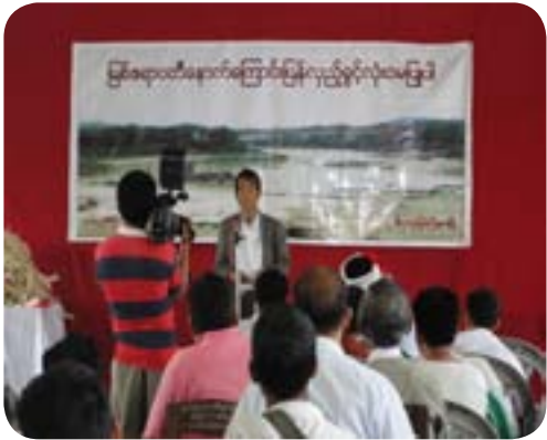
ဒေသခံပြည်သူများ မြစ်ဆုံရေကာတာကို ဆန့်ကျင်သော လှုံ့ဆော်မှုပြုလုပ်နေစဉ်

အားလုံးကိုရရှိခံစားနိုင်ရေးအတွက် အထူးအရေးကြီးသည့်အပြင် လူ့အခွင့်အရေးစံချိန်တပြိုင်တမကြီး အထူးသဖြင့် စီးပွားရေး၊ လူမှုရေးနှင့် ယဉ်ကျေးမှုဆိုင်ရာဖွံ့ဖြိုးတိုးတက်ရေးအခွင့်အရေးနှင့် ကိုယ်ပိုင်ပြဌာန်းခွင့်တို့၏ အခြေခံကျသောအချက်တချက်ဖြစ်ပါသည်။ ကိုယ်ပိုင်ပြဌာန်းခွင့်တွင်လူမျိုးစုတစုရေးအစဉ်အလာကတည်းကနေထိုင်လာခဲ့သောမြေမှာတွေ့ရှိသည့်သဘာဝဝတ္ထုဓနများ၊ သယံဇာတများအားလုံးအပေါ် အပြည့်အဝအာဏာ ပိုင်ဆိုင်ခွင့်ရှိသည်။