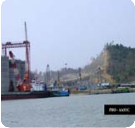
ကျောက်ဖြူမှ ပင်လယ်ဆိတ်ကမ်းတည်ဆောက်ထားသောနေရာ