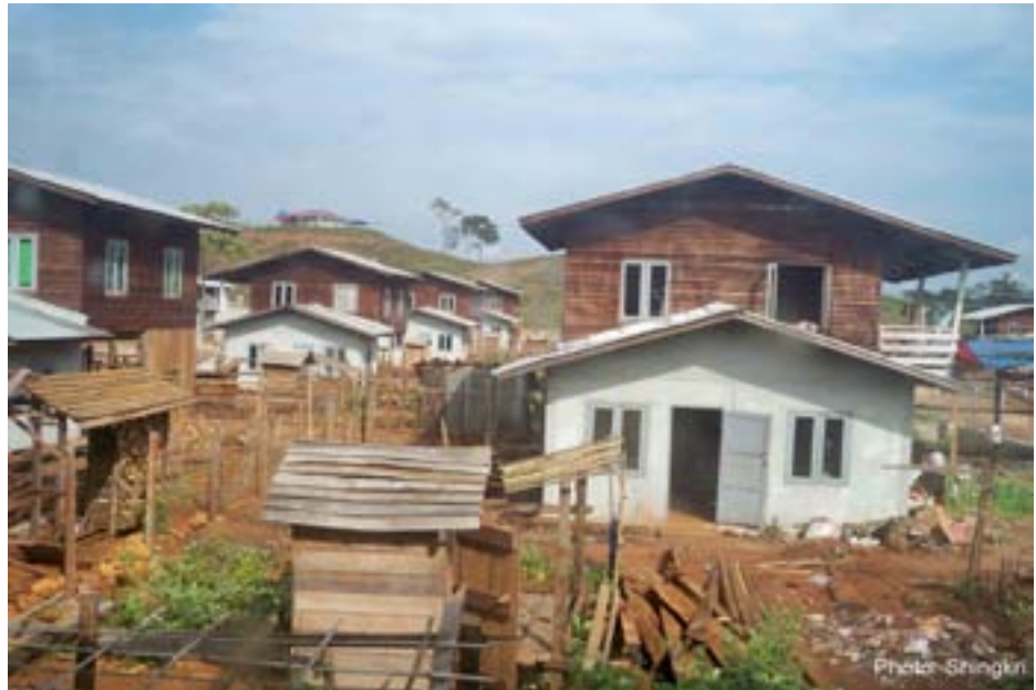
အောင်မြင်သာမှ ရွာသစ်ပုံ

“ဒီရွာသစ်မှာ ကျမတို့က အေရဝေါဆီကအထောက်အပံ့ကို တနှစ်စာဘဲရတယ်။ ဒီနေရာမှာ စိုက်ပျိုးစရာ မြေလည်းမရှိတော့၊ ကျမတို့မှာ ဘာလုပ်ရမှန်းမသိတော့ပါဘူး။ ဒါကြောင့်မို့လို့လည်း လူတိုင်းက တန်ဖဲရွာဆီကို ပြန်ချင်ကြတာပေါ့။”