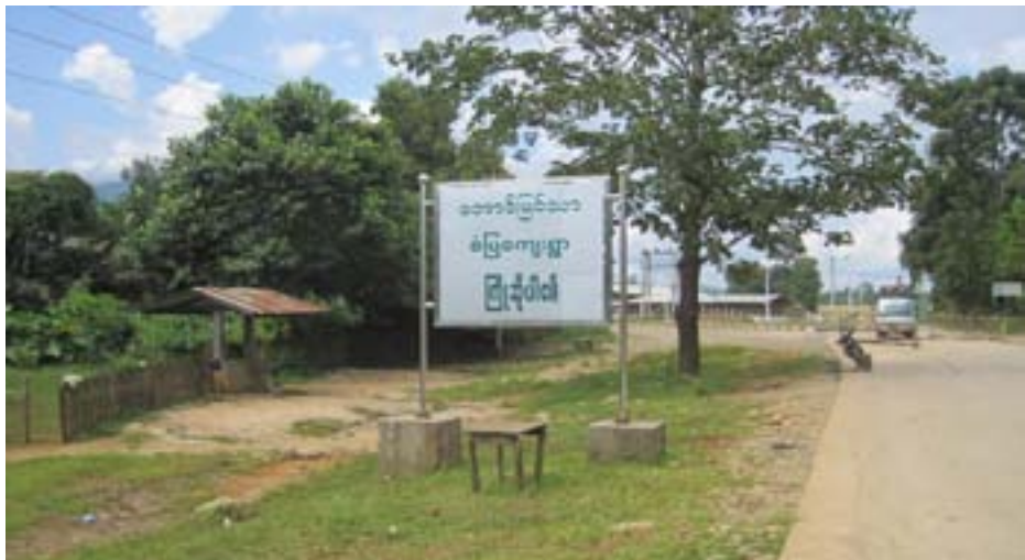
အောင်မြင်သာရွာမှ အဓိကကျသော စစ်ဆေးရေးဂိတ် စခန်း

ထွက်ဆိုချက်။ ကျေးရွာသားတွေကို ပြန်လည်နေရာချထားရေးစခန်းတွေမှာ ပြောင်းနေခိုင်းတယ်။