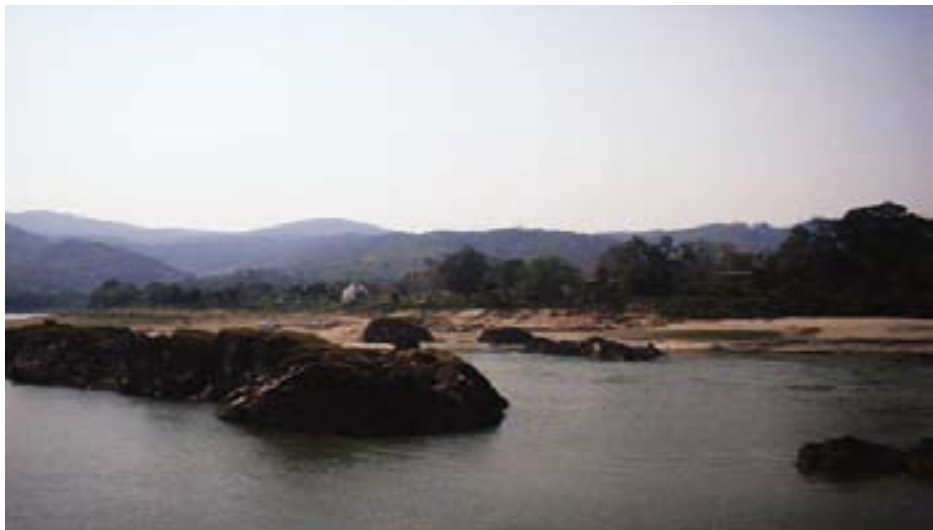
ကချင်ပြည်နယ်မှ မပျက်စီးခင် မြစ်တစ်ခု

ကမ္ဘာ၏ “ဇီဝမျိုးကွဲစုံလင်ထွေပြားမှုအတွက် အရေးတကာအရေးကြီးဆုံးနေရာ” ၅၁ တခုအဖြစ်လည်းကောင်း၊ ကမ္ဘာ့သဘာဝပတ်ဝန်းကျင်ထိန်းသိမ်းရေးတွင် ဦးစားပေးနေရာတနေရာအဖြစ်လည်းကောင်း