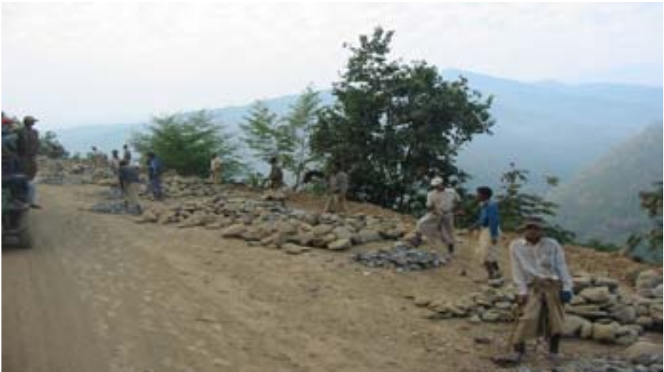
တီတိန်မြို့-ရိဒ်လမ်းတစ်လျှောက်တွင် ပြည်သူလူထု လုပ်အားပေးစေခိုင်းမှုများပြုလုပ်နေသောပုံ

အိန္ဒိယသည် ချင်းပြည်နယ်အတွင်း လမ်းများတည်ဆောက်ရေးမှာ အကြီးအကျယ် ရင်းနှီးမြှုပ်နှံခဲ့ရာ၌ ဤကိစ္စအတွက် မြန်မာအစိုးရကို ဒေါ်လာ(၂)သန်း ထုတ်ပေးမည်ဟု သိရသည်။ ၉၂ ထို့ပြင် ကီလိုမီတာ (၁၆၀)ရှည်သော တမူး-ကလေး-ကလေးမြို့ မော်တော်ကားလမ်း အဆင့်မြင့်ခြင်းနှင့် လမ်းပြန်ခင်းခြင်း လုပ်ငန်းနှင့် ကုလားတန်ခေတ္တနေရာချထားရေးနှင့် ပို့ဆောင်ရေးဆိပ်ကမ်းစီမံကိန်း (Kaladan Multi-Modal Transit Transport Project)တို့တွင်လည်း တက်တက်ကြွကြွပါဝင်ခဲ့သည်။ ၁၉၉၄ ခုနှစ်က အိန္ဒိယနှင့် မြန်မာနိုင်ငံတို့သည် နယ်စပ်ကုန်သွယ်ရေး စာချုပ်တခုကို သဘောတူလက်မှတ်ရေးထိုးခဲ့ပြီး၊ ၂၀၀၅ ခုနှစ် အရောက်တွင် နှစ်နိုင်ငံကုန်သွယ်ရေးကို ဒေါ်လာ(၃)ဘီလျံ တန်ဖိုးအထိရောက်အောင် (၃) ဆတိုးရန်လည်း မကြာသေးမီက သဘောတူခဲ့ကြသည်။ ၉၃ ၉၄ အိန္ဒိယက မြန်မာနိုင်ငံအစိုးရအားမီးရထား လမ်း သယ်ယူပို့ဆောင်ရေးလမ်းနှင့် လျှပ်စစ်ဓာတ်အား ပို့ဆောင်ရေးလိုင်းများအတွက် ဒေါ်လာ သန်း(၃၀၀)လည်း ထုတ်ချေးခဲ့သေးသည်။ မြန်မာနိုင်ငံမှာ လောင်းကြေးကြီးကြီးထပ်ထားကြောင်းပြသ လိုက်ခြင်းဖြစ်သည်။ ၉၅