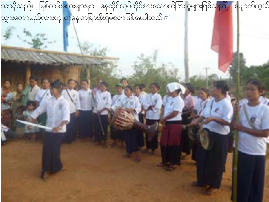
ကယန်း ယဉ်ကျေးမှုပွဲများ ပြုလုပ်ကျင်းပနေသောပုံ

ဖွံ့ဖြိုးရေးစီမံကိန်းများ၏ ဆိုးကျိုးသက်ရောက်မှုများ (အများအားဖြင့်အဓမ္မပြုကျင့်ခြင်း၊ အတင်းအဓမ္မလုပ်အားစေခိုင်းခြင်း၊ ပေါ်တာဆွဲခြင်း၊ မြေသိမ်းခြင်း၊ အတင်းအဓမ္မနှင့်ထုတ်ခြင်း)သည် တိုက်ရိုက်ခံစားရသူများတွင် ပြီးပြတ်သွားသည်မဟုတ်ဘဲ၊ လူမျိုးစုတိုင်းရင်းသားများ၏ နောင်လာနောက်သားမျိုးဆက်များ အပေါ်သို့လည်း ဂယက်ရိုက်အကျိုးသက်ရောက်သည်။ သာဓကအားဖြင့်ဖော်ပြပါမည်။ အတင်းအဓမ္မနေရာရွှေ့ပြောင်းခိုင်းခြင်းခံရရာ၌ ရွှေ့ပြောင်းပေးရသူတို့မှာ မိမိတို့၏ မိရိုးဖလာအသက်မွေးဝမ်းကျောင်းလုပ်ငန်းကို ဆက်လက်လုပ်ကိုင်နိုင်မည့် သင့်တော်သောနေရာတနေရာရရှိရေးမှာ ကြီးစွာသော အခက် အခဲနှင့် ကြုံတွေ့ကြရသည်။ လူမျိုးစုတိုင်းရင်းသားအတော်များအဖို့ မိရိုးဖလာအသက်မွေးဝမ်းကျောင်း လုပ်ငန်းဆိုသည်မှာ စိုက်ပျိုးရေးလုပ်ငန်းအမျိုးမျိုးဖြစ်ပါသည်။ သို့ရာတွင်အတင်းအဓမ္မရွှေ့ပြောင်းခိုင်းခံ ရသူများကိုလွှတ်တီးခေါင်နယ်မြေ၊ သို့မဟုတ်အဝေးပြေးလမ်းမကြီးဘေးမှာ နေရာချထားလေ့ရှိတတ်ရာ၊ သူတို့တတွေ၏ အဓိက အသက်မွေးဝမ်းကျောင်းလုပ်ငန်းများ ဆုံးရှုံးကြရသည်။ ဖြစ်ရပ်တခု၌ ကရင်နီပြည်နယ်ရှိ အဓိကမြစ်ကြီးများကို ဆည်ဆောက်လုပ်ခြင်းကြောင့် အိုးအိမ်အခြေပျက်ခဲ့ကြရပြီး၊ ဤတွင် ယင်းတလဲလူမျိုးစု (ကရင်နီလူမျိုးစုဝင်လူမျိုးတမျိုးဖြစ်ပြီး၊ လူဦးရေ ၁၀၀၀ ပတ်ဝန်းကျင်သာရှိသည်။ မြစ်ကမ်းဘေးများမှာ နေထိုင်လုပ်ကိုင်စားသောက်ကြသူများဖြစ်သည်) ပျောက်ကွယ်သွားတော့မည်လားဟု တနေ့တခြားစိုးရိမ်စရာဖြစ်နေပါသည်။ ၁၀