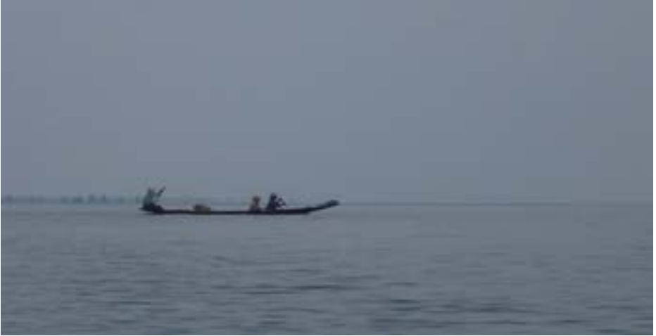
ကယန်းဒေသမှ ရွာသားများ

ထွက်ဆိုချက်။ “ဒီစီမံကိန်းအကြောင်းကို ကျနော်ဘာတခုမှ မသိပါဘူး”