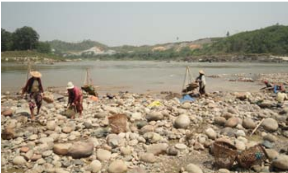
ရွာသားများ မြစ်ဆုံတစ်လျှောက်တွင် အလုပ် လုပ်နေပုံ