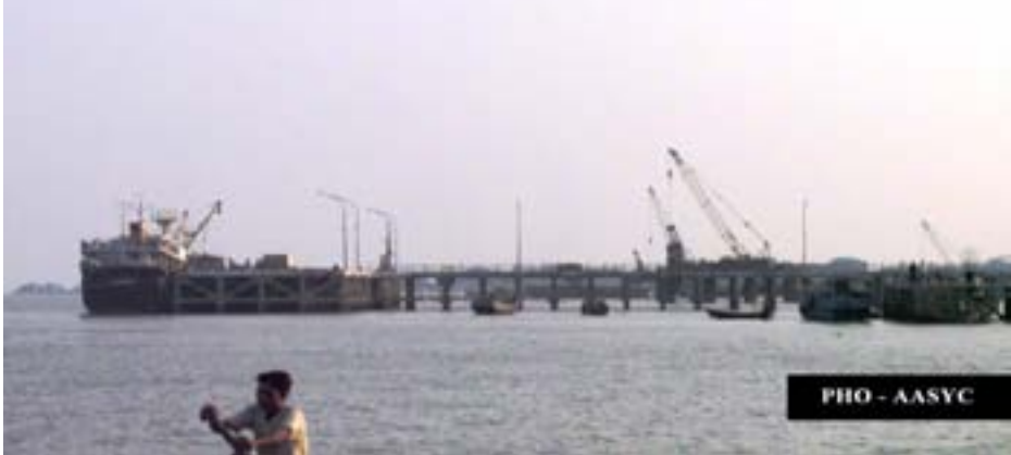
၁၀၆။ Information taken from monthly updates on Sittwe Seaport provided by Arakan Rivers Network

၀ စစ်တွေအနီးမှာ အလုပ်လုပ်နေကြသူများနှင့် နေထိုင်နေသူများက မိမိတို့၏နေအိမ်များ၊ သို့မဟုတ် အလုပ်လုပ်ရာနေရာများကို သိမ်းယူမည်လားဟု အလွန်စိုးရိမ်နေကြသည်။ အကြောင်းမှာ ဆိပ်ကမ်းနားမှာ သိုလှောင်ရုံ(၃၀)ခန့်ဆောက်လုပ်ရန် အစီအစဉ်ရှိသောကြောင့်ဖြစ်သည်။ ဤနယ်မြေထဲတွင် လက်ရှိအချိန်၌ လူနေအိမ်များ၊ စားသောက်ဆိုင်များနှင့် အခြားစီးပွားရေးလုပ်ငန်း များရှိနေကြသည်။ “လျော်ကြေးလုံလုံလောက်လောက်မရမှာကို ကျနော်စိုးရိမ်နေတယ်။ ကျနော်စားသောက်ဆိုင်က ဆိပ်ကမ်းဆောက်တဲ့နေရာနဲ့သိပ်နီးတော့ ကျနော်စားသောက်ဆိုင်အဖယ်ခံရမှာ သေချာတယ်။”ဟု စစ်တွေမြို့သားတဦးက ပြောပြပါသည်။ အခြားတဦးကမူ “တချိန်ချိန်မှာဖယ်ဖို့အမိန့်ပေးလာရင်ကျနော်တို့မှာ ဖယ်ပေးရုံကလွဲလို့ ဘာမှမတတ်နိုင်ဘူး။ တရားဥပဒေစိုးမိုးမှုမှမရှိတာ”ဟုဆိုပါသည်။