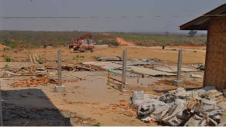
ဖားအံ အထူးစီပွားရေးဇုန်