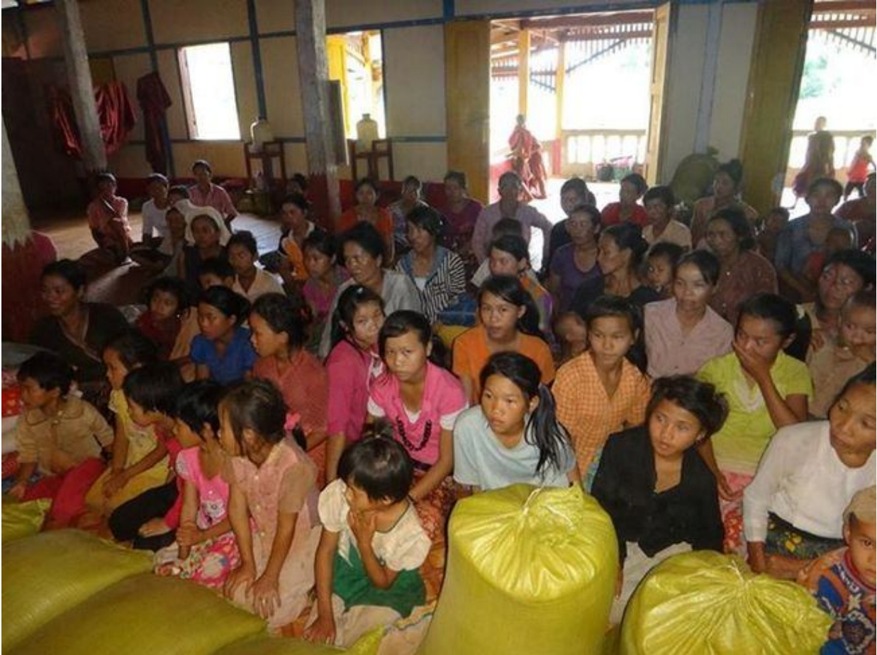
ကျေးရွာတစ်ရွာအတွင်းရှိဘုန်းကြီးကျောင်းအတွင်းသို့ ပင်ရောက်ရှိလုံနေရသောစစ်ပြေးဒုက္ခသည်များ

“အခုဆိုရင်ကျွန်မတို့ ရဲ့မြေပဲခြံရောပြောင်းဖူးခြံတွေရောဘာမှမကျန်တော့ဘူး။ မြန်မာစစ်သားတွေက ကျွန်မတို့ ခြံစည်းရိုးတွေကိုဖျက်ဆီးပြီးခြံထဲကစိုက်ပျိုးပင်တွေအပေါ် ဒီတိုင်း တက်နင်းသွားကြတယ်။ ကျွန်မရဲ့ ပြောင်းဖူးနဲ့ မြေပဲပင်တွေဆိုရင်ပွင့်စဘဲရှိသေးတယ်။ အခုတော့ကျွန်မတို့ အဓိကမှီခိုအား ထားစရာ စိုက်ပျိုးခြံတွေအကုန်လုံးပျက်စီးကုန်ပြီ။ ကျွန်မလည်းဘာဆက်လုပ်ရမယ် မသိတော့ဘူး။ ပြီးတော့ပမာစစ်သားတွေကရွာသားတွေရဲ့ ကြက်တွေကိုလဲဒီတိုင်းဘဲသတ်စားကြတယ်။ ကျွန်မတို့ လည်းလဆုတ်ရက် ( ၂၀၁၄ ခုဇွန်လ ၂၆ ရက်နေ့ ) ကတည်းကထွက်ပြေးလာခဲ့တာဘဲ”။