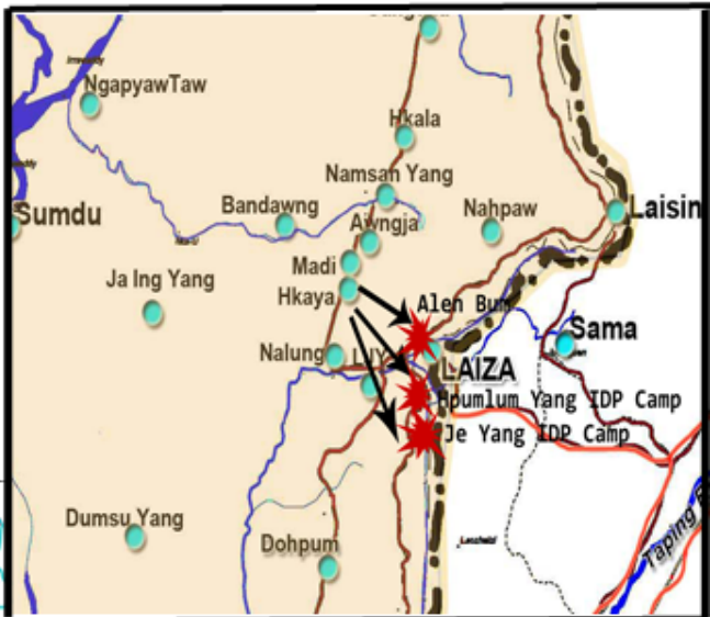
နိုဝင်လားလ ၂၃ ရက်နေ့ လက်နက်ကြီးဖြင့် ပစ်ခတ်ခြင်း