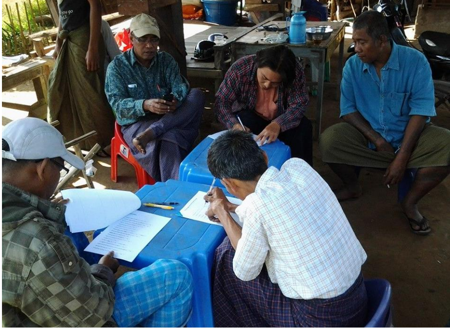
နိုင်ငံရေးအကျဉ်းသားဟောင်းများမှ အချက်အလက်မှတ်တမ်း ကောက်ယူသည့် မေးခွန်းလွှာတွင် ဖြည့်သွင်းနေကြစဉ်

မှတ်တမ်းကောက်ယူသူများမှ ယခုလက်ရှိအချိန်အထိ ရန်ကုန်တိုင်းဒေသကြီးတွင် ရန်ကုန်မြို့နှင့် ဒလမြို့နယ်၊ ပဲခူးတိုင်းဒေသကြီးတွင် ပဲခူးနှင့် ပြည်မြို့နယ်၊ ဧရာဝတီတိုင်းဒေသကြီးတွင် လပွတ္တာ၊ မြောင်းမြ၊ အိမ်မဲ၊ ဝါးခယ်မ၊ ကျောင်းကုန်း၊ ကျုံပျော်၊ ပုသိမ်နှင့် ဘိုကလေးမြို့နယ်၊ မန္တလေးတိုင်းဒေသကြီးတွင် မိတ္ထီလာ၊ မလှိုင်၊ မန္တလေးနှင့် ပခုက္ကူမြို့နယ်၊ မကွေးတိုင်းဒေသကြီးတွင် ရေနံချောင်း၊ ချောက်၊ ကျောက်ပန်းတောင်းနှင့် ပုပ္ပိုး၊ ရှမ်းပြည်နယ်မြောက်ပိုင်းတွင် ကျောက်မဲ၊ သီပေါနှင့် လားရှိုးမြို့နယ်၊ ရခိုင်ပြည်နယ်တွင် တောင်ကုတ်၊ သံတွဲ၊ ဝှံ့နှင့် ကျိန်တလီမြို့နယ်၊ ထိုင်း-မြန်မာနယ်စပ်တွင် မဲဆောက်မြို့နယ်နှင့် နို့ဖိုး၊ အုန်းဖျံ၊ မယ်လစခန်းများ စသည့်နေရာဒေသများတွင် မှတ်တမ်းအချက်အလက်ကောက်ယူပြီးဖြစ်ပါသည်။