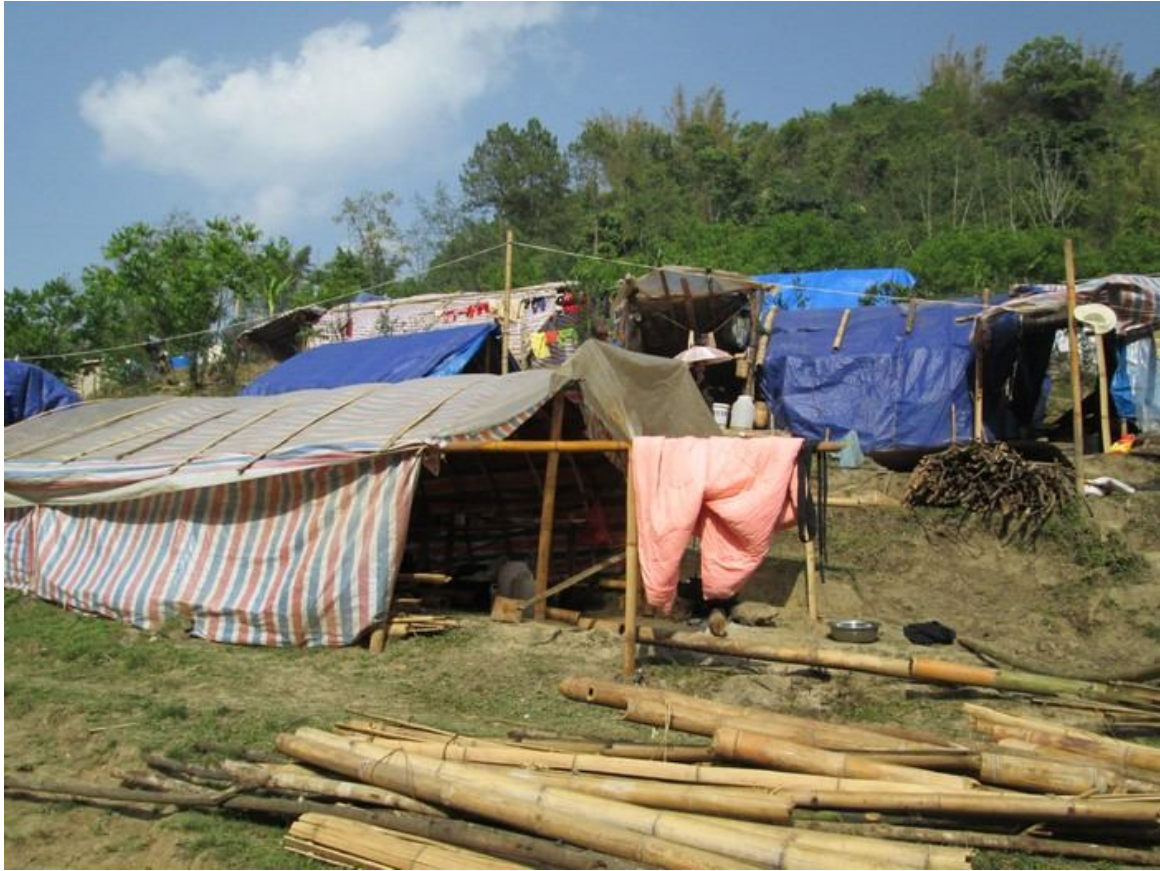
ပင်သင်းရှခင်းပုံးလေးကခင်ရှခင်းပုံးလေးရှ်တီးကပ်ရှင်းရှုရင်း