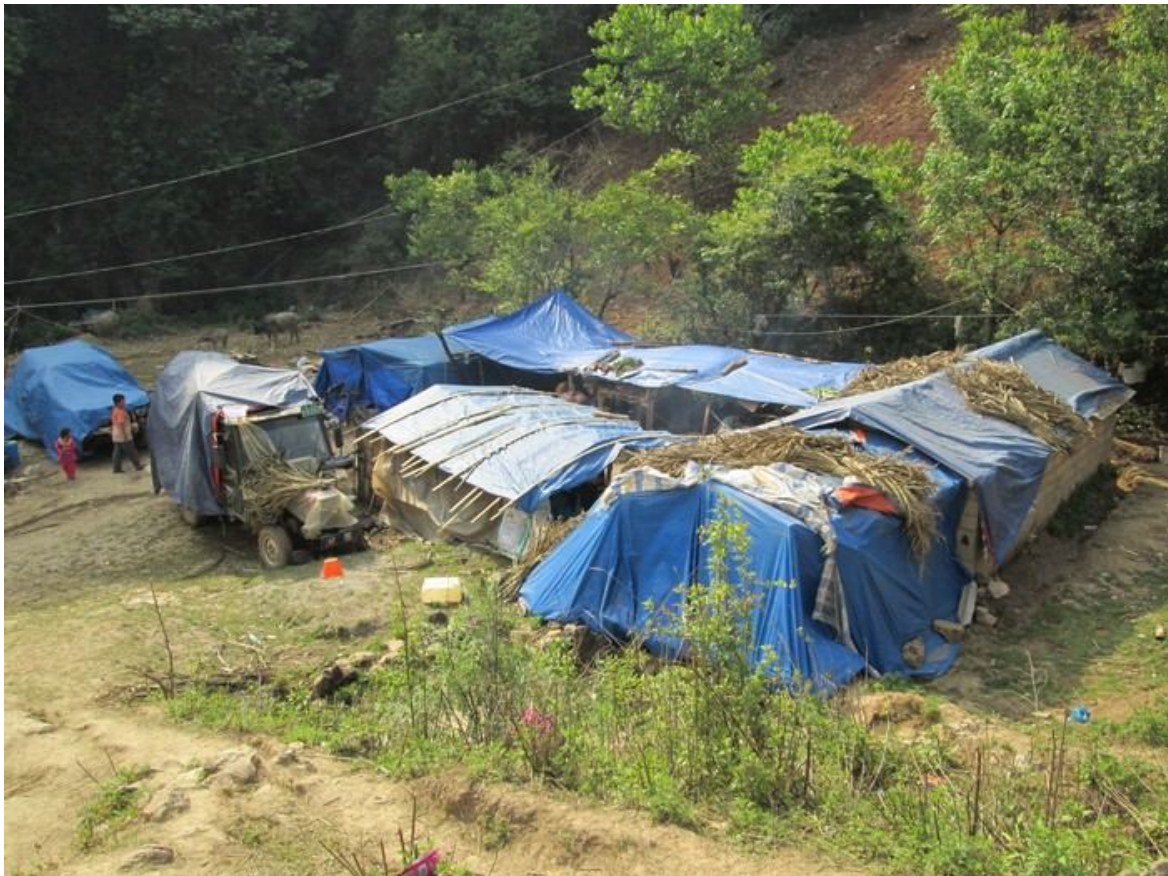
ပင်သင်းရှခင်းပုံးလေးကခင်ရှခင်းပုံးလေးရှ်တီးကပ်ရှင်းရှုရင်း