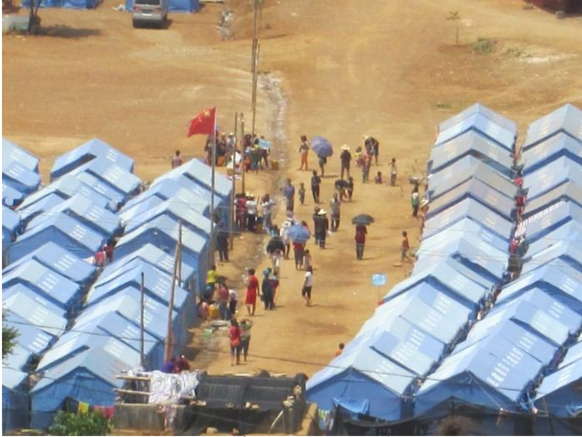
ပင်သင်းရှုခင်းပျံးပေးကန်လင်းခရီးတီးခမ,သင်ပခင်