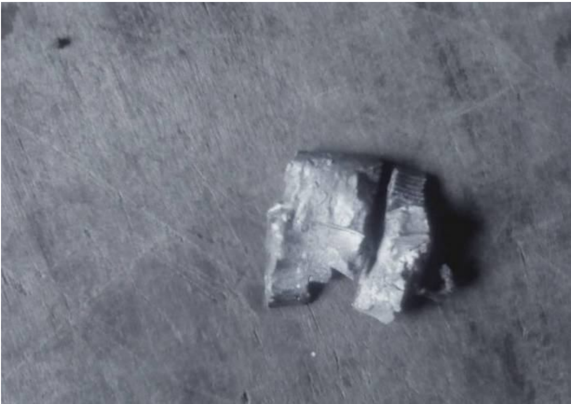
လခ်,မခ်,ကခမ်တိုင်.ဂျးပးသို

ဗွင်းလံးငိခင်းသိုင်ခွင်;လိုင်ယိုဝ်းယူ,ခခမ်. ပးသိုက်းယူ 38 ဂခမ်းဝခမ်းမို,လိခမ်လိုင် မံးလိုင်လွင်းရှင်, လူမ်း; လွတ်းဗေးလခမ်လံးမခမ်းကခမ်တိုက်.ရှ်တံးသူခမ် ခိပ်,တာင်းယူ,ရှင်,ဂံဝခမ်း;ခပ်မွက်; 2 လက်း ခခမ်.ယူ။ မခမ်းခခင်းဂေး;ကွက်,ရှိုခင်းကခင်းဂျးရှင်.လခမ်လံးမခမ်းပွက်; ဂုလ်းဂး; ဗွင်းတိုက်.ဂျးလွမ်း တာင်းခခမ်. မခ်,လိုင် လက်;ခိုင်;တိုက်.တိက်,ရှိုမ်းမခမ်းသေလခ်,မခ်,တိုင်.သို,တီးပုမ်မခမ်းခခင်း။