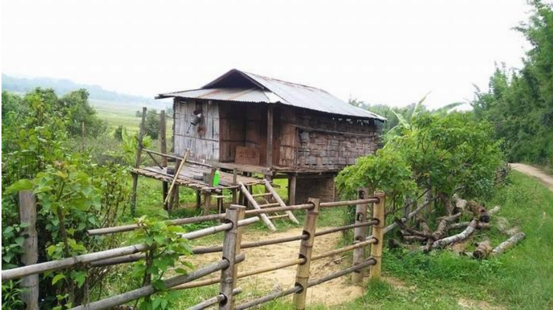
ရှိုခင်းလုင်းလူခင်.ခပ်ပေးလုဂ်း

လုင်းလူခင်.ခခ.ပိခင်ရှူခင်းဝခင်း;ရှူခင်းသုခင်ဂိတ်းဂိခင်ရှူးခေးသေ မိးခးသွင်ပေးလုဂ်းယူ,လွမ်းဂခင်။ ဝခင်း ခခခခ.လုဂ်း;လံးမခင်းဂျးဂိခင်လၢင်းလီင်.ဂုင်းပိုခင်း;တၢင်း,ဝခင်း;သေ ဂိုတ်းလုင်းလူခင်.ယူ,ရှိုခင်းဝံ. ဂေ့. လိပ်။