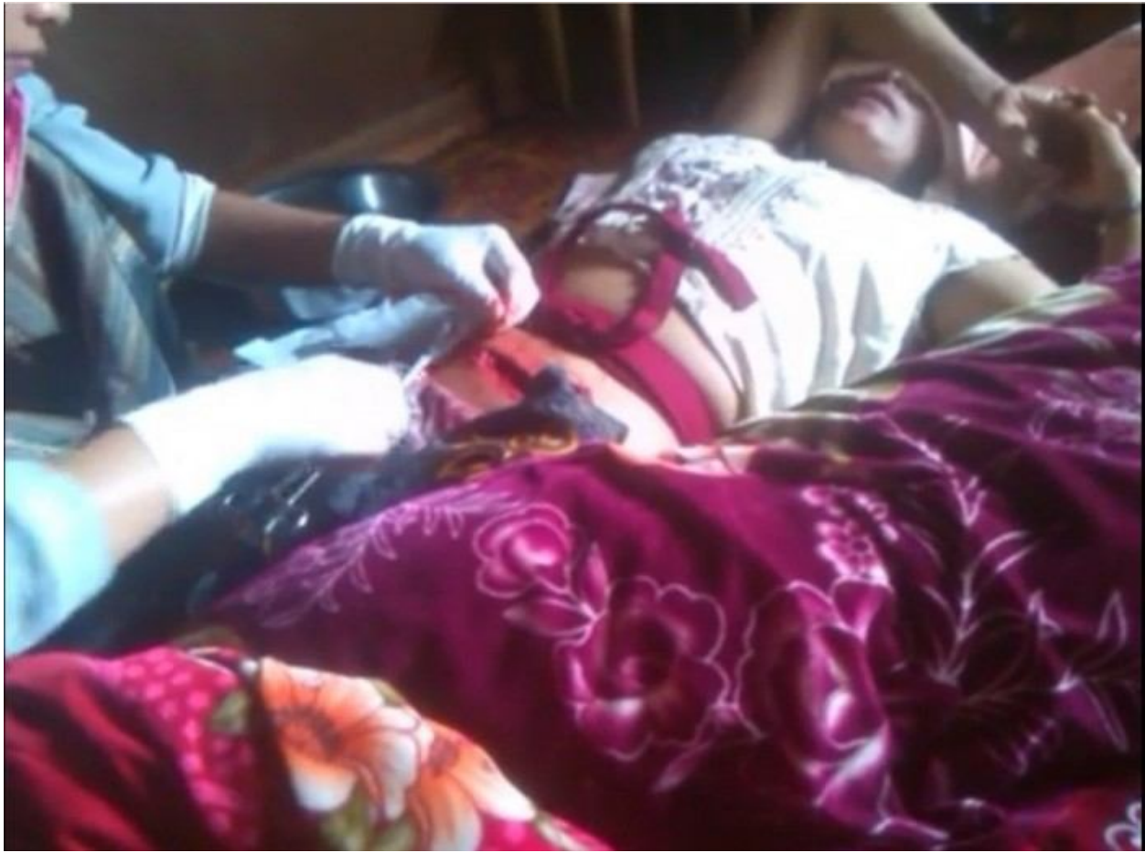
မေ့ယုခင်းပိုခင်.တီးကပ်လက်,မက်,တီးပုမ်ပူးသို့ကွက်,

ကမ်,မီးလဝ်းခေးတီးဃော့,သိုက်းမာခမ်း ကမ်,ခခေဃော့,လူင်ပွင်လိုင်;မူးဂူတ်,ထတ်း ငလးရှပ်.ကပ်ပုခမ်း ဗွခမ်း လွင်;ယိုက်းမက်,လူင် သေတိုဝ်.လူးဂူခမ်းမိုင်းခခေ.သင်။ တပ်.ရွင်သိုက်းမာခမ်း; 249 တင်းတပ်. ရွင် 513 ခ်.ယု,ပူးတုံးဂုမ်းဂမ် တပ်.လုမ်းလူင်သိုက်းမာခမ်း; 55 ကခေပက်းတီး; ဂတ်,လေး. (ဂလေး) ခင်းလိုင်; တီးပွတ်းလခမ်းခခေ.ယပ်.။