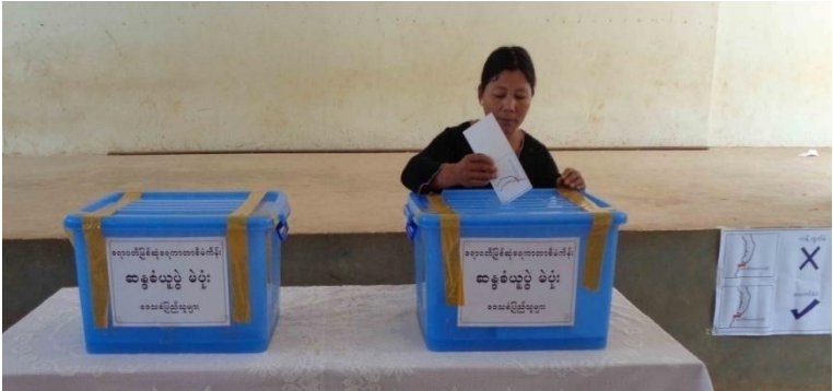
မြစ်ဆုံဆည်စီမံကိန်း နှင့်ပတ်သတ်ပြီး လူထုဆန္ဒခံယူပွဲ ၂၀၁၄

ကုမ္ပဏီနှင့်အစိုးရမှ မြေယာတို့ကိုသိမ်းယူခြင်း၊ လူထုအပေါ် ခေါင်းပုံ ဖြတ်ခြင်း (သို့) ၎င်းတို့၏ စီးပွားရေးအကျိုးအမြတ် တစ်ခုတည်းကိုသာ ကြည့်ပါက ပြည်သူများအနေဖြင့် လွတ်လပ်စွာထုတ်ဖော်ပြော ဆိုခွင့်နှင့် ဆန့်ကျင် ကန့်ကွက်ခွင့်ရှိရမည်။