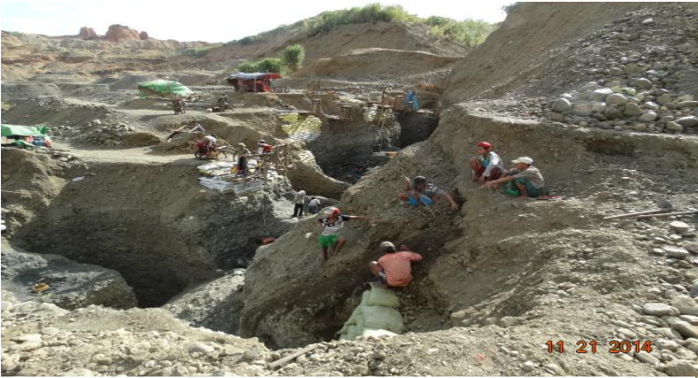
၂၀၁၄ခုနှစ်၊ ဖားကန်တွင် တနိုင်တပိုင်ကျောက်စိမ်းတူးဖော်နေပုံ

တွေ့ရသည်။ အပစ်ရပ်စဲရေးကို ပထမအဆင့်ပြုလုပ်မှာဖြစ်ပြီး အကြီးစား စီးပွားရေးဖွံ့ဖြိုးရေး စီမံကိန်းတို့ကို စက်မှုလုပ်ငန်းများမှတစ်ဆင့်ပြုလုပ်သည်။ တစ်ပြိုင်နက်တည်းတွင် နိုင်ငံရေး တွေ့ဆုံဆွေးနွေးမှုများနှင့် ဖွဲ့စည်းပုံ ပြဿနာများဖြစ်သည့် သဘာဝသယံဇာတတို့ကို စီမံခန့်ခွဲခြင်းနှင့် အကျိုး အမြတ် တို့ကို ခွဲဝေသုံးစွဲခွင့်တို့ကို လစ်လျူရှုထားသည်။ 7