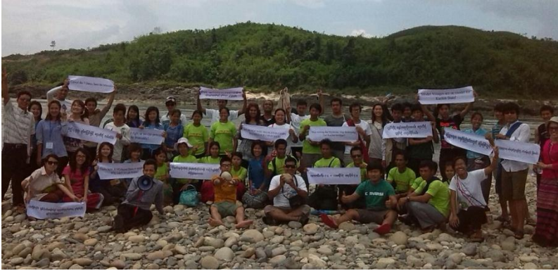
၂၀၁၄ တွင် ဒေသခံ ကချင်ပြည်သူများ၏ မြစ်ဆုံရေကာတာ (ဆည်) ဆန့်ကျင်ရေးလှုပ်ရှားမှု

၂၀၀၈ ဖွဲ့စည်းပုံအရ အကယ်၍ ကချင်ပြည်နယ် လွှတ်တော် အမတ်များအားလုံး၊ တပ်မတော်သားအမတ်များ၊ ပြည်နယ်ဝန်ကြီးချုပ် အပါအဝင် မြစ်ဆုံဆည်စီမံကိန်းကို အပြီးရပ်တန့်ဖို့ရန် နေပြည်တော် အစိုးရ၏ သဘောထားနှင့် ဆုံးဖြတ်ချက်မပါပဲ အကောင်အထည်ဖော်၍ ရနိုင်မည် မဟုတ်ပေ။ နေပြည်တော် အစိုးရ ကသာ ဆုံးဖြတ် ပိုင်ခွင့်ရှိသည်။