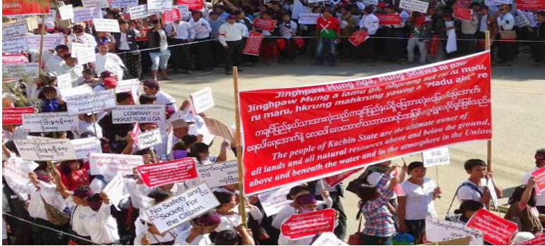
ဒေသခံပြည်သူများမှ သယံဇာတတူးဖော်သောကုမ္ပဏီကြီးများရပ်ဆိုင်းရန် တောင်းဆိုခြင်း - ဖိးကန့် ၂၀၁၄

ခ။ ကချင်ပြည်နယ်အား လိုင်စင်ထုတ်ပေးခြင်းအပါအဝင် သဘာဝ သယံဇာတ ဖွံ့ဖြိုးရေးဆိုင်ရာ ပြည့်ဝသော စီမံအုပ်ချုပ်ခွင့်၊ ဥပဒေ ပြုခွင့်နှင့် အတည်ပြုခွင့်အာဏာကို ရှိရန် သေချာအောင် ပြုလုပ် ပေးရမည်။