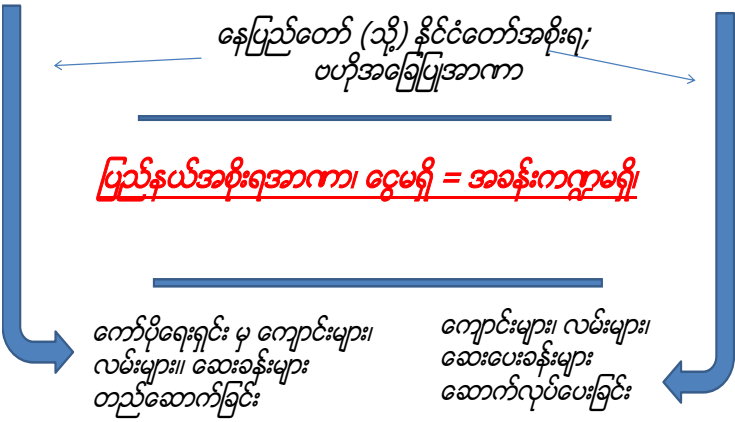
Corporations and UN/INGOs operating as unelected defacto state governments