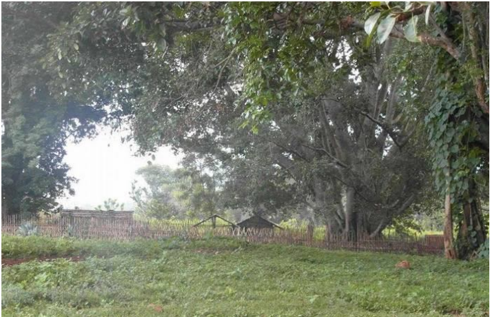
ဘုန်းဗဟိုကီးဝေက်ာ်၎င်းကပ္ပု ဗမာစစ္စပူခန်း

သေဆုံးသူနန်းခက်အား တွေ့ရှိခဲ့သည်နှင့် မိ ခင်မှာ သမီးဖြစ်သူ၏အလောင်းအား အဝတ် ဖြင့်ဖုံးအုပ်ထားကာ၊ သေဆုံးသူ၏ ခင်ပွန်းဖြစ် သူ စိုင်းကာဝိမှ ရွာအတွင်းရှိ ရွာသူကြီးနှင့် အ ခြားရွာသားများအား လိုက်လံခေါ်ဆောင်ခဲ့ ပြီး မှုခင်းနေရာအား စစ်ဆေးခဲ့ကြသည်။ ယင်းသို့ ရွာသားများမှ စစ်ဆေးခဲ့ရာ အလောင်းအနီး တစ်ဦးထက်မနည်းသည့် စစ်ဘွတ်ဖိနပ်ရာများ ကိုတွေ့ရှိခဲ့သည့် အပြင်၊ ဆံပင်အချို့နှင့် သွေးများပေကျနေသည့် တုတ်တစ်ချောင်းကို လည်း တွေ့ရှိခဲ့ကြသည်။ ယင်းတုတ်ချောင်း မှာ စစ်တပ်ကင်းစခန်းအမိုးဆောက်လုပ်ရာတွင် အသုံးပြုလေ့ရှိသည့် တုတ်ချောင်းအမျိုးအစားဖြစ်သည်။ ခြံလုပ် ရာတွင် အသုံးပြုသည့် နန်းခက် ပိုင်ဆိုင်သည့် မါးမသည်လည်း သွေးများပေကျလျက်ရှိပြီး သူမ၏အလောင်းအ