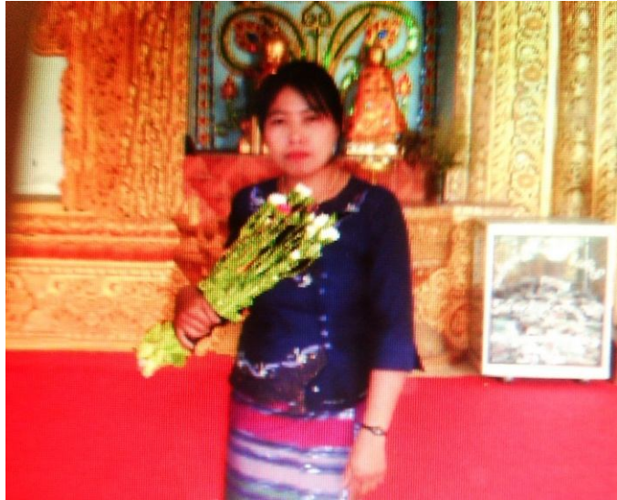
ခေင်ခေင်,

လွင်းကန်ဆုခပ်သိုက်: ဂျော့တီတ်. တွပ်,ထိုင်ဝုးလုဂ်;ခွင်.တပေးမခမ်းကမ်,လံးရှ်တီးဗိတ်းခမ်ခေင်. ဂူခမ်း ဝါခမ်းလေးလဝ်း;သုးခင်းဝတ်.ဂေးကမ်,ဗွမ်.သေ ထိုင်မုးဝမ်းထီ 08/06/2015 ခေင်. လဝ်းရှာခမ် ဂူလု,ယခမ်,ဇိမ်းတူ,ရိုင်, ဗူးဂွမ်းတပ်.ဂွင်ခလယ 249 ကခပ်ပတ်းတီး;မိုင်းပိုင်း ငလ;ဝိုင်းရှုပ် ပိုင်းလင်းမုးလူးသေလွံး;ဂေးလိတ်;လိုင်;ခေင်.။