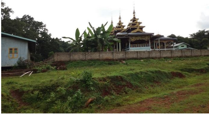
ဝတ်.ရှင်း တိုင်း ကဆင်လီဆင်ဂျုံဝတ်.သိုင်းမာခင်းတိုင်းလမ်း

ဗွင်း 06:00 မှင်းရှင်ခမ်းခေခေ. ခပ်လံး ထူပီးရှင်ခမ်းတူဝ်တံ ခေခင်းခိတ်,ရှိုမ်း တင်း ခင်းခင်းဝတ်.ရှင်း တိုင်းခင်းဝါခင်း ခေခင်းခေခေ.ယပ်.။ မခင်းခေခင်းခေခင်း တံခေခင်းလိခင်း သေ ကမ်း,မီးသိုင်းခွင်း တိုင်း လွမ်းတူဝ်သင်း၊ သိခင်းမခင်းခေခင်း ဂေခင်းခေခင်းမတ်. ခေခင်း မခင်းခေခင်းဝံ.။ လှိုင်းခေခင်း.မခင်းခေခင်း ယင်းမီးရှိုမ်း လိပ်း တီးဂင်းခင်းခင်း,ဂေခင်း ထိုင်; လိပ်းလှူး သေလွင်းလွင်းပေ.ထုပ်.ဝံ.သေ တူဝ် မခင်း ခေခင်းဂေခင်းပိခင်း လှိုင်းတင်း တူဝ်။