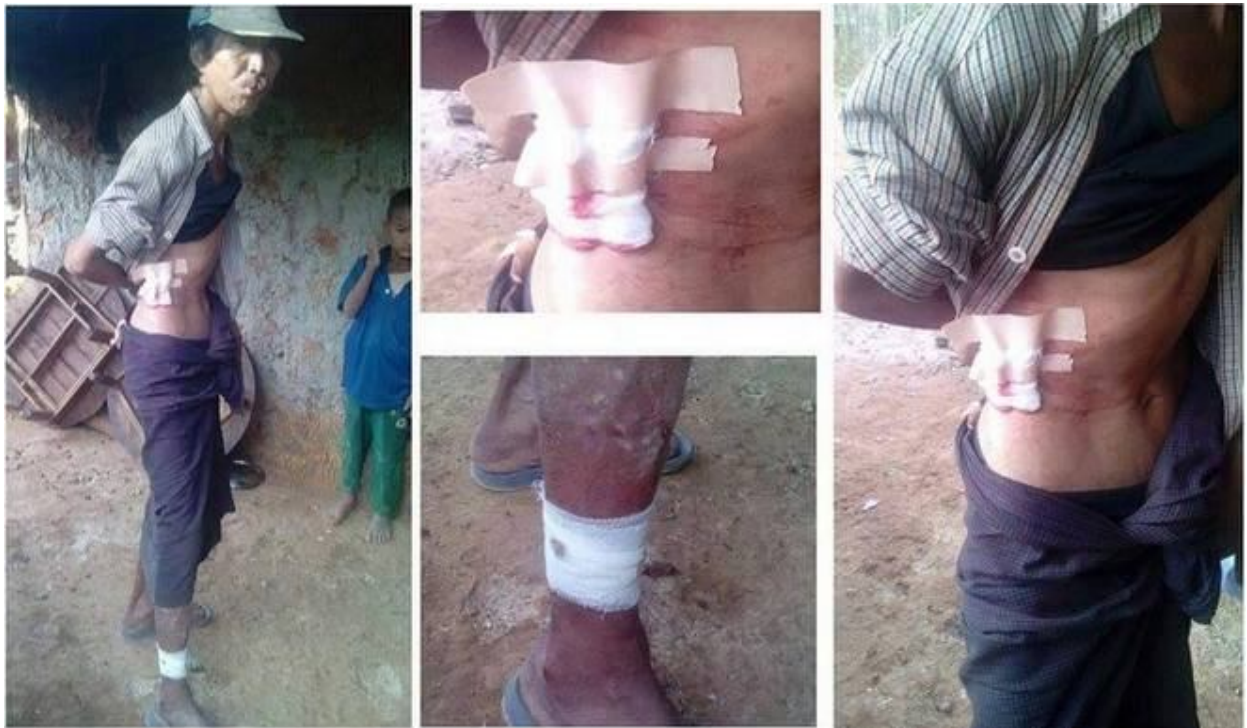
ထီးဗေ, ဂျေ.ဂျားလၢဂ်,မၢဂ်,တိုဝ်.သ့,

မၢဂ်,လူင်သွင်လုဂ်းတူဂ်းဂိုမ်းဂိုုခါးအၢင်းဂေ, ကဆ်ကၢယုလီ; 28 သေတိုဂ်.ပျးတွင်.ဝံ.ဂဝ်းလို့ခါ။ ဗွင်းမၢဂ်,လူင် မၢးတူဂ်းဆဆ်.မိဆ်းဗွင်းမဆ်းအၢင်းတိုဂ်.တေခဝ်းမိုဝ်းခင်းဂိုုခါးမဆ်းအၢင်းသေ လီ;တိုဝ်.လၢဂ်,မၢဂ်,တီးခါမဆ်း အၢင်းငလးဂိုုတီးဂိုုမဆ်းအၢင်းလိမ်းတူဝ်ဂျာ။