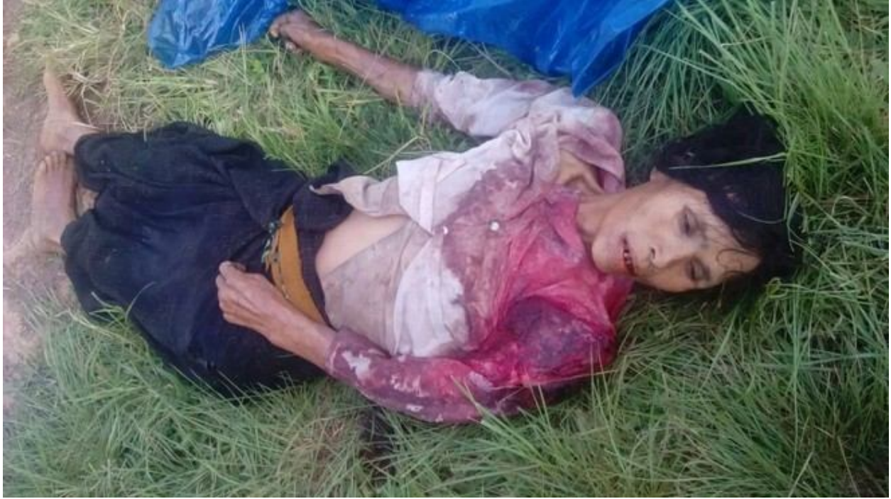
ပူးဂျာ၊ ဂျေ.လီထုဂ်၊ သိုဂ်းမာခ်းတင်းလုံယိုင်းသေယိုင်းတံ၊

ဝံးဆခ်းသိုဂ်းမာခ်းခပ်ခပ်ဂျာခင်းဝတ်.ဆွင်ပုတီပ်းဂျာသေ ဂျာမိုဝ်းသွဂ်းတင်းလွမ်းဂွင်းဆွခ်း၊ တူးသိုဝ်းဗား /ဝီ၊တူး၊ လွမ်းထူင် လိုဝ်းဆိ.သေယိုင်းဂွင်းခပ်ထိုင်း။