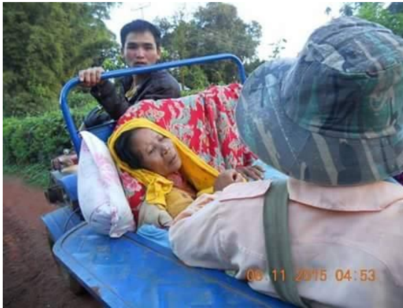
ပုးတိုင်. ဂျေ.လီးမာတ်,လိပ်ဂျာပ်.ဂိုင်း

ဂျူင်းယျ။ ထိုင်မွန်း၊ 6:30 ဂျူင်ခမ်းဂွမ်း၊ သိုင်းမာမ်းလင်၊ခွင်းပခင်းကွဲကွဲခင်းဝါခင်း၊ မာတ်၊လိပ်ခင်းသို့၊ ဆုံးထွင်း (ထော၊လျ၊ဂျီ၊) သေသွင်း၊ဂျ၊လူးဂျူင်းယျမိုင်းခွင်။