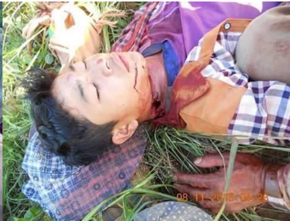
လားခမ်းပာင်, ဂျေ.လီးမာတ်,လိပ်ဂျာပ်.ဂိုင်း

ဂွမ်းပိုင်းလိပ်ဂျာပ်.ဂိုင်း ဂျေ.ပိုင်ခိုင်း ယွမ်းတီးဂျူင်းယျမိုင်းခွင်ကမ်းမီးမေယျခပ်ယူ,ဝိ.ဂျေ.လွင်းခိုင်း သေဂျူင်းယျမိုင်းခွင်ကမ်း,ဂုပ်.ယူတ်းယျခပ်လေးလင်,လီးကပ်ဂျ၊ ဂျူင်းယျလွံလိမ် ကမ်းမီးခင်းတင်းဂို လုဂ်.မိုင်းခွင်ဂျ၊ 90 လမ်းခင်းယပ်.။ ထိုင်ထိုင်ခင်းခိုင်းမားသိုင်းမာမ်းခပ်ဂျင်းဂိုခင်းသေသိုပ်,ကပ်သွင်းဂျ၊ခိုခင်းဂျူင်းယျသိုင်းခပ်တီးကုမ်းပင်း (ကွင်,ပခင်း) လိုင်းတီးပွတ်းလခင်း ကမ်းမီးခင်းတင်းဂိုထိုင် 90 လမ်းခင်းယူ,ယပ်.။