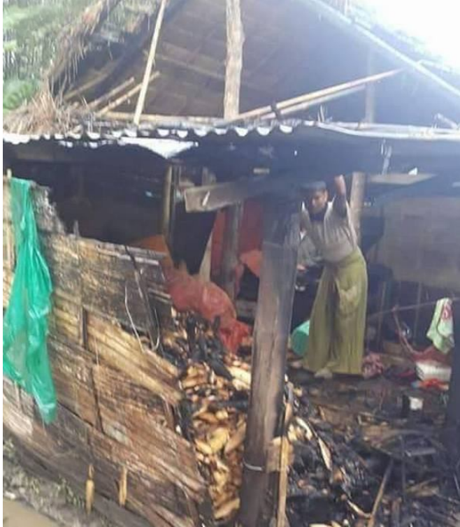
လွင်းလူလိပ်ယွမ်.မာန်,လှိုင်ကန်မားတိုဝ်.ဂျားဂျိအ်းလေးဖှီးမီးပျားယွင် ခပ်းဂပ်, ပျးဇီမ်,