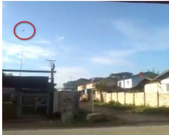
ဂျုမ်းမိဆ်းမိပ်းမီးသိုက်မာဆ်းလမ်းဆိုင်ကဆ်တိုက်ပံ့မာဂ်၊သ့မိုင်းဆွင် ဝမ်းထိ 10.11.2015

တပ်းသိုက်လူင်ပွင်လိုင်းမာဆ်း ငတ၊ပိုတ်းယိုဝ်းမိုင်းဆွင် ခမ်းခိုဆ်းဝမ်းထိ 09/11/2015 ဆ်းယဝ်။ သိုက်မာဆ်း တီးတပ်း ငဝ်းငုဆ်းဂုမ်းဂမ်ဖ်ဆ်းဂါဆ်းယဆ်းသိုက် (လဂခ) 2 ကပ်ဂွင်လူင်ယိုဝ်းခမ်းဆ်း မိုင်းဆွင် ဂျုမ်းတင်း ဝါဆ်းဆေး လိဆ်းလိင် ကဆ် ယူ၊တင်းတိုက်ဝိုင်း။ သိုက်မာဆ်းကပ်မာဂ်၊လူင်ယိုဝ်းလူင်ဂျု၊ဂိုတ်းဆ်း တော့ထိုင်ဂါဆ်းမိုင်းလိင်ဆ်း ဝမ်းထိ 10/11/2015 သေမီးပုးလွင်းကပ်ဂွင်ကွဆ်းယိုဝ်းလွမ်းဖွင်၊ လွင်းဆ်းဂိုတ်းဂျုမ်းဆ်းယေးဂူဆ်းမိုင်းဆ်းပွဂ်။ 1 ငလးပွဂ်၊ 4 ပုးတင်းဝါဆ်း ဆေးလိဆ်းလိင်လုဂ်ဖွင်။ ဂူလုးဂျုးဂါမံ၊လီငလး၊ ကမ်၊မီးဖ်လုလံးဂုပ်၊မာတ်၊လိပ်း ဂွပ်း ဝုးဂူဆ်းမိုင်းကွဆ်းဂမ်ပံးမိပ်းလွမ်းဂျုး လုဂ်းလိဆ်းတီးပံးမာဂ်၊ကဆ်ခတ်းဝံးလွမ်းဂိုမ်းဂျုမ်းဂျုမ်း ဖွင်သိုက်မာဆ်း ကပ်မာဂ်၊လူင်ယိုဝ်း။