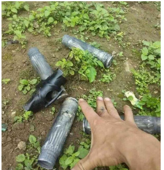
မာဂ်၊ဖောင်း ဂျုမ်းမိဆ်းတိုက်သိုက်မာဆ်းကဆ်ပံ့လူင်း ဝမ်းထိ 10/11/2015 ထူပ်းဂုဆ်းဆ်းဝါင်းဂျုမ်းဂိုဆ်းလဆ်းသုင်မိုင်းဆွင်

ဂူလုးဂျုး ဖွင် မွဂ်းခါဝ်းယါမ်း 08:00 မူင်းဂါဆ်းဆ်း ဝမ်းထိ 10/11/2015 ဆ်းသိုက်မာဆ်းကပ်ဂျုမ်းမိဆ်းမိပ်းမီး ငလးဂျုမ်း မိဆ်းတိုက် (ဂျိုတ်း) မိဆ်းဖာတ်းဆိုင်ဝိုင်းမိုင်းဆွင်သေ ပံ့၊မာဂ်၊လူင်းလူးဝိုင်း၊ ဂိုတ်းဂျုးဂျုမ်းဂိုဆ်း ငလး တိုက်မာင်လိုဝ်းလုဂ်၊ ယွဆ်း လတါဂ်၊မာဂ်၊သေဂိုတ်းဂျုးမေ့သွဆ်းလိဂ်းဂျုမ်းဂိုဆ်းဂေ့၊ဆိုင်လံးဂုပ်၊မာတ်၊လိပ်းဆ်းဂျုမ်း မဆ်းဆောင်း။