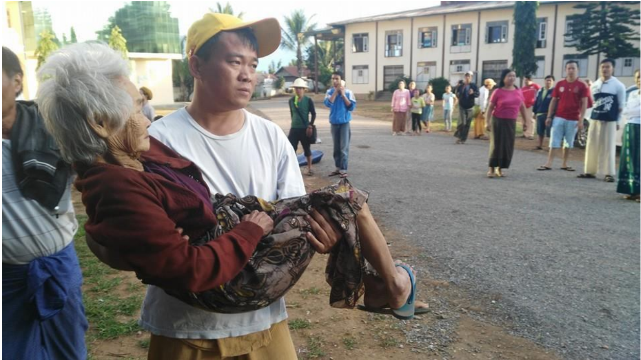
ထပ်းယိုင်း ဂူခင်းမိုင်းဆွင် ကခင်းလိးပးပေးမးပိုင်းဂျိုမ်းတီးလိးခး

ခင်းဝန်းထိ 12/11/2015 အခင်းသိုက်မာခင်းခပ်ကွက်,ဂျမ်းသင်,ဝါး ဗင်တေကမ်,လိးကွက်,ဂျိုခင်းဂျ,တောင်းလုံ၊ ဂွမ်းဝါးခိုခင်း ဆီ.သိုက်တီးတေမးယိုဝ်းဂွမ်းခပ်ယပ်။ ဆွန်းသေအခင်းသိုက်မာခင်းယင်း ဂျမ်းတပ်းဂူခင်းမိုင်းဂျ,မး ခပ်/ကွက်,မိုင်းဆွင်လေး တတ်းပးလိင်းဟူခင်းထိင်း။ ပိတ်.သမ်.ပိခင်းခပ်ပတ်,ခပ်သေတျ.သိုက်မာခင်း ဂျမ်းတပ်းဂူခင်းဝါခင်းဂူခင်းမိုင်းကမ်,ဂျိုးဂျ, သူခင်း ဂျိုး ချား ပတ်,ခပ်ဆွန်းဝိုင်းလေးကပ်တောင်းတုတ်.ဂိခင်းယပ်,ဗိုတ်,ခင်းဂါခင်းဂျလိင်.တွင်.ပိုင်.သျှ,ဂူခင်းမိုင်းထိင်း။