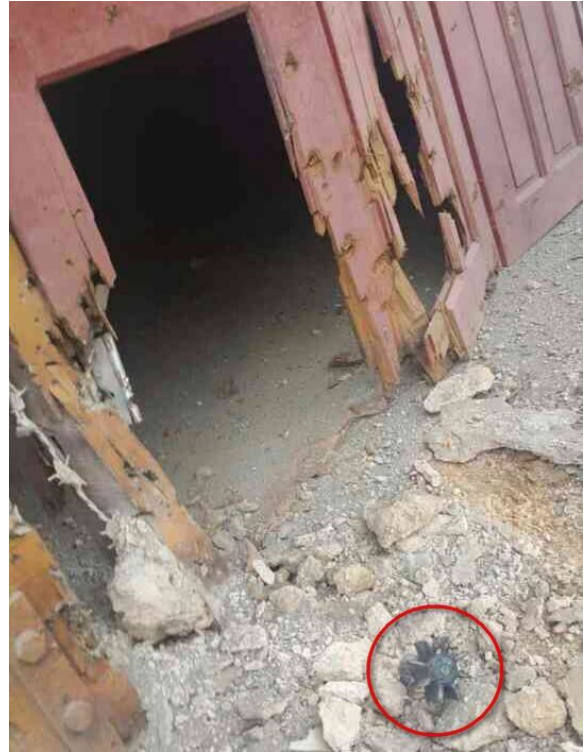
လွင်းလူလိပ်ယွမ်.မာန်,လှိုင် တီးဂျိအ်းလင်းလော့,မိအ်း လေးပျးမွအ်း

ဂူအ်းခွဲးပိုအ်းတီးလံးထုဂ်,ဂုမ်းခင်သေလိတ်းထာမ်လွင်းသိုဂ်းတီးခပ်ယူ,ဂျးလုံလိမ်လိဝ်းအိ။ လင်းလောမ်,လျအ်. ၈၅.၅၇, ပာင်လျ. ပိုအ်းခွဲးပွဂ်. 1 သေပွဂ်မားအခမ်. ဖွင်းဂင်ဝအ်းတိုင်; ခွဲးဝအ်းထိ 10/11/2015 သိုဂ်းမာအ်း; လုမ်းခိုင်မွဂ်; 50 ၈၅. တိလွင်းကပ်မအ်းတီးဂျိအ်းသေကပ်ဂျ,လွမ်းခပ် ပျးတင်ဂူအ်းလေးထိုင်သွင်ဂေ့. ကပ်ဂျ,လူးတပ်.ခပ်တီး တပ်. 286 ကမ်မီး တာင်းတူဂ်းဝိုင်။ သိုဂ်းမာအ်းတွင်းထာမ်ခပ် ဂိပ်,ဂပ်းလွင်းဝျး လွင်,ခပ် ကပ်သိုဂ်းသိုဂ်းတီးသိုင်,ဝိ။ လွင်,ဂျိတ်းခပ်; ဖဂ်းလိုင်.သိုဂ်းတီး အိလိဝ်းအခမ်. ခာပ်းတာင်းခိုင်လူဂ်းမူင်းသေခိုအ်းပွ,ခပ်ခိုအ်း။