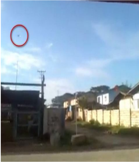
หนึ่งในเฮลิคอปเตอร์ของทหารพม่าที่ใช้ทิ้งระเบิดในเมืองหนองในวันที่ 10 พ.ย.2558

อย่างไรก็ดี ประมาณ 08:00 โมงเช้าของวันที่ 10 พฤศจิกายน เฮลิคอปเตอร์และเครื่องบินรบของกองทัพพม่าได้บินวนเหนือเมือง และทิ้งระเบิดใส่ใจกลางเมือง สร้างความเสียหายให้กับโรงเรียนมัธยมและอาคารใกล้เคียง โดยมีครูคนหนึ่งได้รับบาดเจ็บจากสะเก็ดระเบิดระหว่างอยู่ในบ้านพัก