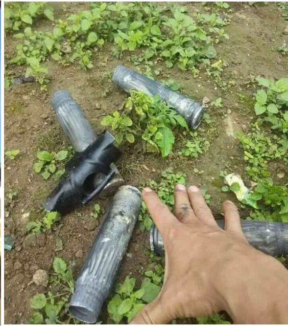
กระสุนจากเครื่องบินทหารพม่า พบในบริเวณโรงเรียนมัธยม จากการยิงวันที่ 10 พ.ย.2558

ภายหลังการทิ้งระเบิด ทหารพม่าเริ่มออกปฏิบัติการกวาดล้างในเมืองเพื่อค้นหาทหารชาวไทใหญ่ ผู้หญิงคนหนึ่งอธิบายว่าทหารตะที่ประตูบ้าน บังคับให้เจ้าของบ้านคุกเข่าและจะฆ่าทุกคนในบ้านถ้าพบว่ามีทหารชาวไทใหญ่หลบซ่อนตัวอยู่ในนั้น