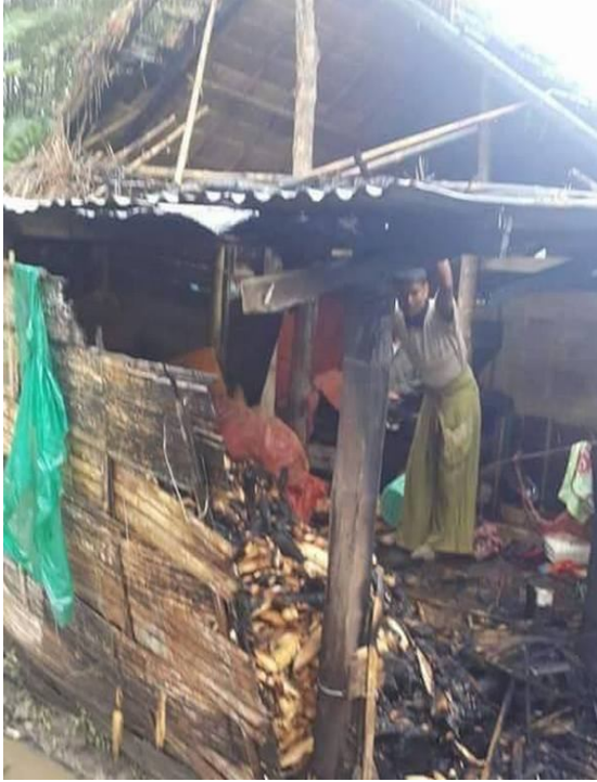
ผู้ข่าว โทคของบ้านแวม ที่เสียหายจากสะเก็ดระเบิด