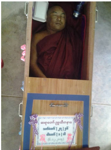
ခါးတူပ်လင်းလင်းသီ,ဂုဆာ,တ ကဆ်လိးလွဆ်,ယူဆ်.ယိပ်,ဂုးမာဂ်,