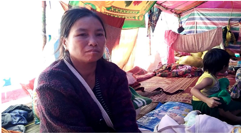
ပျားလွှဲ မေးလှင်းသူ

မိုဝ်းဝမ်းထိ 16/11/2015 ဆခပ်.ဂပ်.ငဝ်းသုခပ်,လိဂူခင်းလိုင်တံး လိးတွင်းထမ် ပျားလွှဲ ၈၂၄ ၈၂၄ ပီခပ်မေး လှင်းသူ ကခပ်ခါ.ပင်သဝ်းဂူခင်းပံးပေးတီးဝါခင်းသေ့.မးတီးဝါခင်းဝ ဆခပ်.ယဝ်.။ မခင်းဆင်း တိုဝ်.ကူဂ်း တိုဝ်.လုံ ထွမ်းကမ်,ဂွမ်.ဂူလှ်းလှ်းမခင်းဆင်းလိးလုသုမ်း ဖူးဂွမ်းဆူးဂိုခင်းဂျ,ဆခပ်. ဂူလှ်း ယင်းတိုဝ်.ကူဂ်းတိုဝ်.လုံပျားလှ်း ကမ်,မီးဖုံလုံထင်ပွဂ်းမိုဝ်း ကပ်ခပ်;တူဝ်တံးဂေ့.ပီခပ်ဖုံမခင်းဆင်း ဆခပ်.သေ ကမ်,ထင်လှ်းလှ်းသင်းဂိုဝ်,လီလီ ယွခပ်.တိုဂ်.မီးပင်တိုဂ်းယူ,ဆခပ်.ယဝ်.။ မခင်းဆင်းဝတ. တိုဂ်.ကိုဂ်.ခိုဂ်.ခင်းလုံဝံ.ယူ, လှ်းဝး တေဂိုတ်းဂိုဝ်သိုဝ်,ဂွမ်း ဆူးဂိုခင်းဂျ,မိုဝ်းဆူးဆခပ်.ယဝ်.။