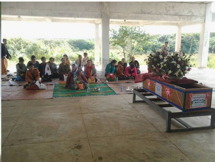
မိုဝ်းလုမ်းလားခါးတူပ်လင်း သီ,ဂုဆာ,တ

ဝါးသေမာဂ်,ဗုင်လိဆ်တိဂ်,ယပ်. ပိဂ်.သမ်.မီးခါပ်,လိုင်းဝုးပိဆ်သိုင်းမာဆ်းခပ်ဂေး.ဗုင်မာဂ်,ပိ. ဂိုမ်းဂွမ်းတပ်.ခပ် ဝါး စတ, ပိဆ်ပာင်တိုင်း ကဆ်သိုင်းမာဆ်းပိုတ်,ဆေးသိုင်းတေး,ပုး,တီ,မ့်,သုင်လိုင်းတီး/တပ်.သိုင်းလိုင်းတီး ဆ်းလပ်. လိုဆ် ကွဂ်းတူပ်ပိုပ်း ဆ်သေတေး.ကမ်,မီးလင်းဆေးတီးသိုင်းမာဆ်းဂေး.လုံမးလူးဝတ်. ပိုဝ်းတေး,မးယွမ်း ဆွမ်း တၢင်းဗိတ်း ကမ်,ဆဆ် ယွမ်းဂုပ်.ကပ်ပုဆ်းဗွဆ်း ခိုဆ်းသင်။ မာဂ်,ဗုင်လိဆ်ကဆ်တိဂ်,သေ ဂိုတ်းဂွံးလင်းသင်, လင်းလင်းခပ် လိးဂုပ်.မာတ်,လိပ်း မိုဝ်းဝဆ်းထိ 30/11/2015 ဆဆ်. မီးတီးဂိုမ်းဂွမ်းတိဆ်လွံတပ်.သိုင်းမာဆ်း တပ်. ဝပ်းငုဆ်း ဂုမ်းဂုမ် ဗိဆ်ဂါဆ်ယဆ်,သိုင်း (လဂခ) 2 မိုဝ်းဆွင် ဆဆ်.ယပ်.။