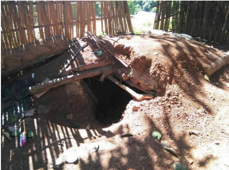
လှိုင်းလိခင်ဂူခင်းဝါခင်း တၢ, ပါးပေးသော, ဂျမ်းလှိုင်းခါး

ဝါးပင်တိုင်းယီခင်ယဝ်. သိုင်းမာခင်းခပ်ပုတ်ယူ, ခင်းဝါခင်းလေး, ဂိုမ်းဂွမ်းဝါခင်းသေ သိုပ်, ကပ်တီးယူ, တီးတပ်. ဂျမ်းခပ် ကခင်းမီးဂိုမ်းဝတ်.။ မိုဝ်းခင်းထိ 14/11/2015 ခခခ. သိုင်းမာခင်းခတ, ကပ်ဗိုင်းခပ်ဂျမ်းလှိုင်းလှိုင်းပလွင်းခင်းဝါခင်းယူ, ယဝ်.။ ခပ်လတ်တီးလင်း, သြ, ခင်းဝတ်. ဝါး, ခပ်ခွဲပခင်းတၢမ်, ဂူခင်း ဝါခင်းကခင်းလှိုင်းထိမ် သိုင်းတကင်းခခခ. ခခ, ခခယဝ်.။ လင်း, သြ, ခင်းဝတ်. ဂေးတုင်းယွခင်းခပ်ယၢ, ဂွဲခပ် လင်ဂျမ်းဂူခင်းဝါခင်းပိတ်တင်းမူတ်.။ ခင်းဝခင်းခခခ. ခပ်ကပ်ဗိုင်းခပ်ဂျမ်း ဂူခင်း 14 လင် တင်းမူတ်ခင်းဝါခင်းမီးဂျမ်းဂူခင်း 35 လင် ဂျမ်းပု, ဂေး, ဂေး, လင်းလၢမ်,။ ခွပ်းခွင်ဂူခင်းဝါခင်း ဂျမ်းတင်း ခပ်ပိုင်း, ခပ်သၢခါ, ခပ်ဂၢပ်, လေး, ဂူခင်းခိုင်းဂျမ်းလမ်းလှိုင်းခခ. လိ, ထုဂ်, ဗိုင်းမီးပု, လှိုင်းဂျမ်းယူ, ယဝ်.။