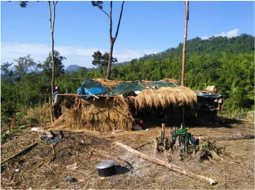
ပင်သဝ်းဂူဆဲးဝါဆဲးပင်ဂါင်;လူဝ်းခါဝ်း ကဆဲပံး;ဖေးသိုက်

ပီဂ်.သမ်.သိုက်မာမ်းကွဂ်,ယါဆဲဝါဆဲးပင်ဂါင်;ဂျ,ယဝ်.သေတေ. ဂူဆဲးဝါဆဲးကမ်,ခွဲ;ပွဂ်;ခိုဆဲးမိုဝ်းယူ,တီးဝါဆဲး ဂပ်,ယွဆဲ.ဆိမိဂ်;ကမ်,လီဆဲဆဲးယဝ်။ ဂွပ်းဆဲတင်းဝတ,ဝါဆဲးထီ 08/12/2015 မးဂူဆဲးဝါဆဲးကွဆဲဂမ်ဝတ,သါင်; ဝါဆဲးမုံ, ကွင်;တီးမုံ, ကဆဲဂျင်,ဂီ ဝါဆဲးဂပ်,မွဂ်းဆိုင်;လဂ်းဆဲးယဝ်။