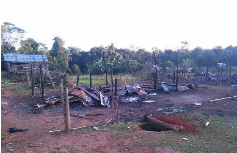
ဂျမ်းဂူခင်းဝါခင်းဂမ်းပွင်းကခင်းသိုင်းမာခင်းကပ်ဗိုင်းခပ်

မိုဝ်းခင်းထိ 15/11/2015 ခခခ. ဂေးမီးပင်တိုင်းဂခင်းခင်းခင်းသိုင်းမာခင်းလေး, သိုင်းတကင်းထိင်းဂျမ်း. ဂိုင်း ဂိုမ်းဂွမ်းဝါခင်းထိင်း။