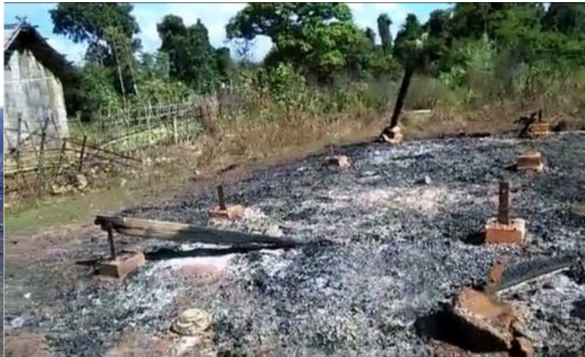
ကွင်းဂျမ်းပု, ဂေး, လင်းလၢမ်, ဝါခင်းပင်ဂါင်း ကခင်းလိ, ထုဂ်, သိုင်းမာခင်းခပ်ပိတ်မူတ်