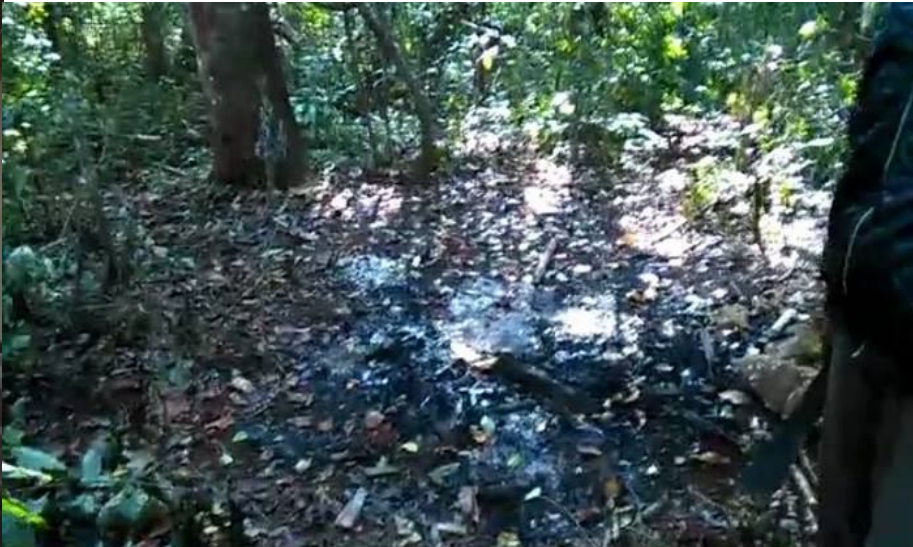
မံဗုဂံ(မတ်.ပူင်,တိဆင်,)မံ,ကံးလၢ. ဂေ့.လုးယိုဝ်းတံ ကွင်းတီးကဆင်မံ,ကံးလၢ.လုးယိုဝ်းတံလး; တီးဂူဆင်းဝါဆင်းလှိုဂဆင်ကပ်ခပ်;တူဝ်မဆင်းဗင်

သိုင်းမာဆင်းခပ်ဂေ့သွတ်းတပ်လွမ်းဆင်းဝါဆင်းသေ ငတ,မုင်းဆားကွတ်,ဂှ,ဆားတၢင်းတူင်း။ ဗွင်းခပ်ဂွတ်းထိုင်တီးပု,ဂိုဝ်း (ပု,လၢ) ကဆင်ယူ,ဆွတ်းဝါဆင်း ဗွင်း ခၢင်းယၢမ်း 5:00 မူင်းဂျုဝ်ခမ်းဆဆ. ခပ်လံးပီဆင်ပၢင်တိုင်းဂဆင်တင်းသိုင်း တကၢင်း ဂၢင်.ဂိုင်း။ သိုင်းမာဆင်းကပ်မၢင်,လှိုဝ်ယိုဝ်းပုးဆင်းဝါဆင်းသေ တိုဝ်.လုးဝတ်. ဝုးလုဂှပုး။ ဂၢမ်,လီလး; လဝ်းဩ,ဆင်းဝတ်. တဆင်းလံး ပံးသော့.၇၂၂၆;ဆင်းလုဂ်းလိဆင်ကဆင်မီးဂိုမ်းဝတ်.ဆဆ.သေ မဆင်းလဝ်းကမ်,တဆင်းလံးမၢတ်,လိပ်းသင်။