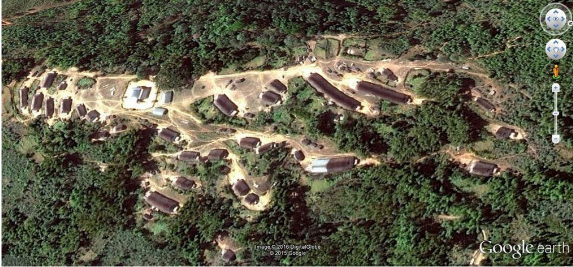
Google earth မှပန်လုံးရွာ

အစိုးရစစ်တပ်မစစ်ဆင်ခြင်းသည့်သံလွင်မြစ်အပေါ် တည်ဆောက်မည့်နောင်ဖာရေကာတာအစီအစဉ်ကြောင့်လည်းဖြစ်ကြောင့်လည်းဖြစ်နိုင်ပါသည်။နောင်ဖာရေကာတာသည်လားရှိုးမြို့အရှေ့ဘက်ပိုင်းတွင်တည်ရှိပြီး ထိုဒေသ ကိုထိန်းချုပ်ထားချင်သည့်သဘောလည်းပါပါသည်။ဟိုက်တရိုချိုင်းနား(တရုတ်ကုမ္ပဏီ) နှင့်ပူးတွဲစီမံကိန်းဖြစ်သည့် နောင်ဖာရေကာတာမှထွက်ရှိမည့်၁၂၀၀မီဂါဝပ်လျှပ်စစ်စွမ်းအင်ကိုတရုတ်နိုင်ငံက၉၀% ယူသွားမည်ဖြစ်ပါသည်။