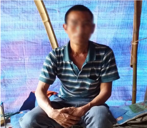
ဖမ်းဆီးနှိပ်စက်ခံရသည့် ကိုးကန့်တိုင်းရင်းသားတစ်ယောက်

ကျွန်တော်တို့ရွာနဲ့နီးနီးနေချင်လို့ နယ်စပ်မှာနေနေတာပါ ။တောင်ယာတွေကို ပြန်ကြည့်ချင်လို့။ အဓိကဝင်ငွေက ကြံစိုက်ပျိုးရေးလေ။ အိမ်ထောင်တစ်စုက တစ်နှစ်မှာ ကြံရောင်းရငွေ ယွမ် ၅၀၀၀ လောက်ရတယ်၊ တချို့ဆိုယွမ် ၂၀၀၀၀ လောက်အထိရတယ်၊ အခုတော့ နှစ်နှစ်ရှိပြီ ကြံမသိမ်းနိုင်ဘူး၊ ကျန်တဲ့ ကျွဲနွားတွေရောင်းပြီး တရုတ်ပြည်ထဲမှာ အသက်ဆက် နေရတာ၊ အခုတော့ ဘာမှ မကျန်တော့ဘူး။