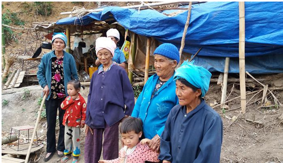
စစ်ဘေးရှောင်နေသည့် ကိုးကန့် အများစုမှာ ခလေးနဲ့ အမျိုးသမီးသက်ကြီးရွယ်အိုများ

ဒီမှာ အရေးအကြီးဆုံးပြဿနာက ရိက္ခာဘဲ။ အရင်က ဆန်လှူတာရဘူးတယ်။ အခုနှစ်လရှိပြီ ဘာမှ မရတော့ဘူး။ ထမင်းစား နိုင်အောင် အလုပ်တော့ ကြိုးစားရှာရတယ်။စခန်းမှာက ခလေးတွေ၊ သက်ကြီးရွယ်အိုတွေ များတော့ အလုပ်မ လုပ်နိုင်ကြဘူး။ အနီးနားက တောင်တွေပေါ်မှာ စားဖို့ဟင်းသီးဟင်းရွက် တွေ သွားရှာကြရတယ်။