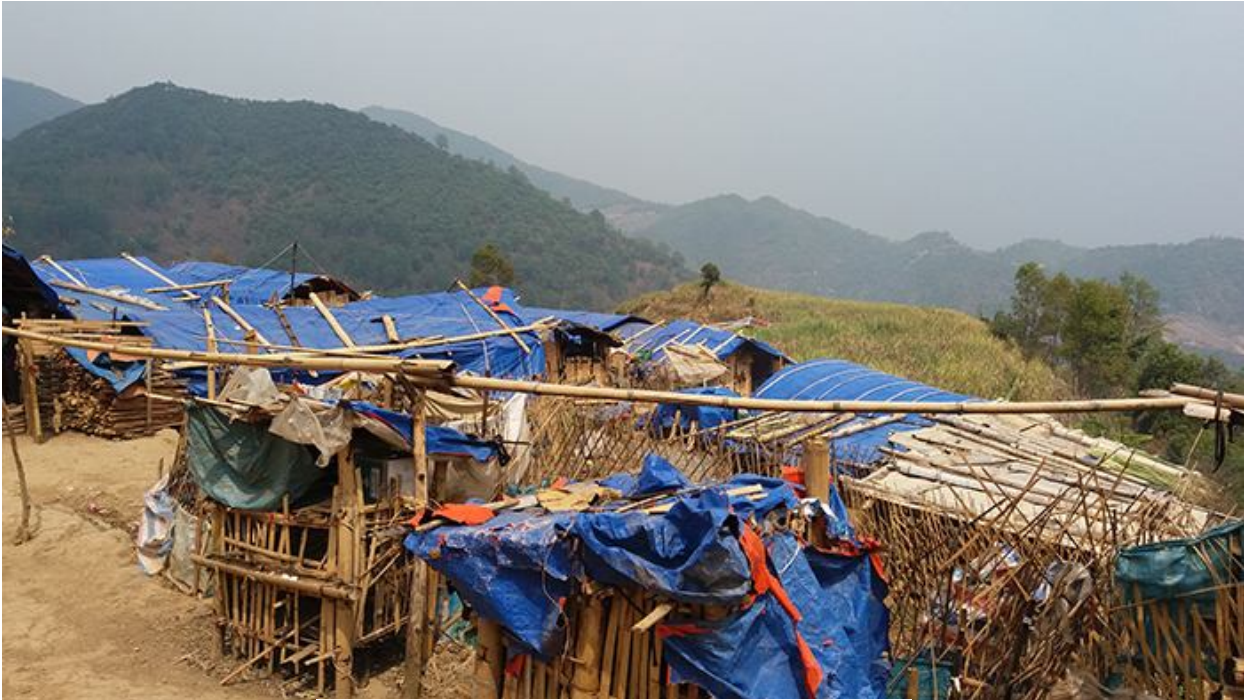
ကိုးကန့် စစ်ဘေးရှောင် တို့ ၏ ယာယီဒုက္ခသည် စခန်း

အနီးနားရှိ လော်ရိန်ကိုင်ရွာက အသက် ၄၀ လောက်ရှိ အမျိုးသမီးနောက်တယောက်လည်း မုဒိမ်းကျင့်ခံရတယ်။ မနစ် သြဂုတ်လက ။ သူ တရုတ်ပြည်မှာ ခိုလှုံနေတယ်။ သူ့အိမ်ကို သူပြန်ကြည့်တယ်။ သူ့ယောက်ျားနဲ့ ခလေးတွေကို နယ်စပ်မှာထားခဲ့တယ်။ စစ်သား တစ်အုပ်သူ့အိမ်ကိုရောက်လာပြီး မုဒိမ်းကျင့်တယ်။ သူက ငိုယိုပြီး ရွာလူကြီးကို သွားတိုင်တယ်။