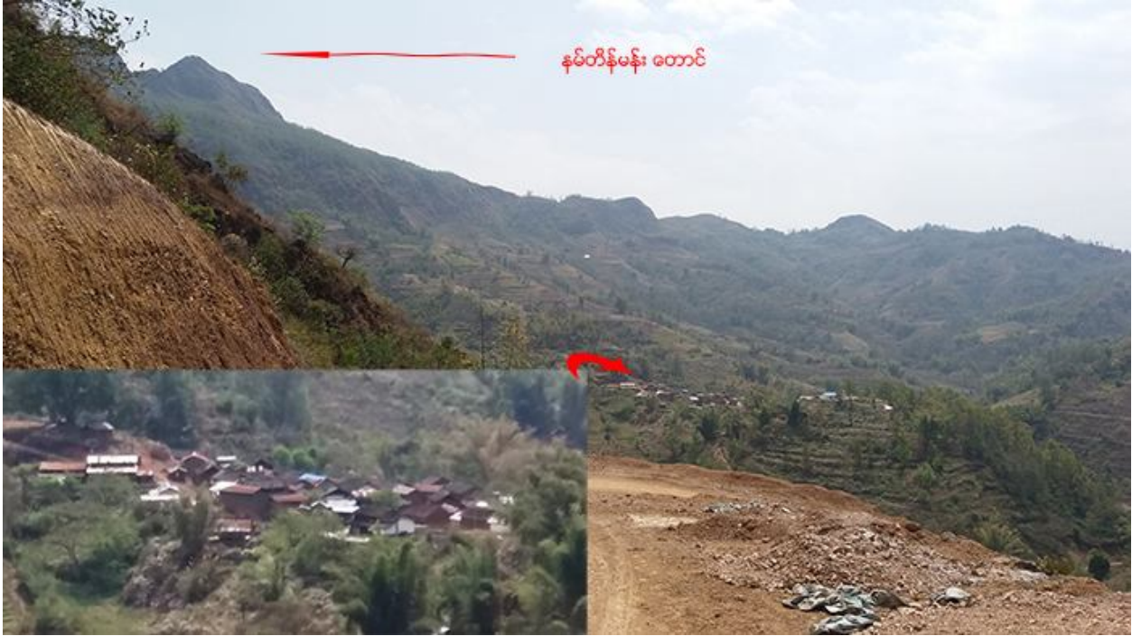
အပြီးစွန့်ခွာခဲ့ရသည့် ကိုးကန့် (ရှောင်လှချန်) ရွာ၏ လူသူကင်းမဲ့နေပုံ