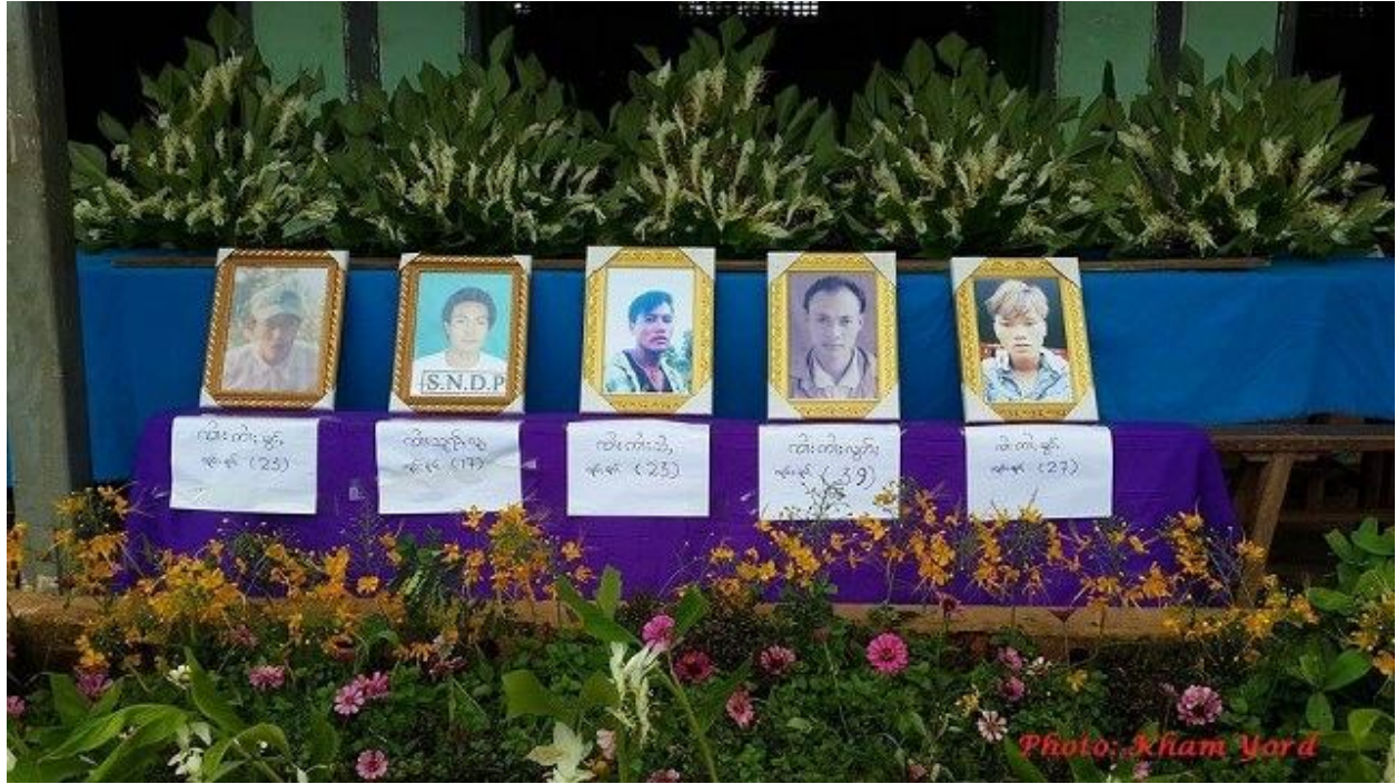
ပင်ဂိုဏ်းသွမ်းပခမ်ဂုဏ်းဝမ်းခင်းမိုင်းယော မိုင်းဝမ်းထိ 02/07/2016

ဝမ်းထိ 02/07/2016 လီးလတ်းပင်ဂိုဏ်းသွမ်းလူ့ပခမ်ခပ်တီးဝတ်./ရွှင်းဝိဂျာရ ထုင်.မိုင်းယောဂျ၊။ လီးခိတ်းပင်းထိုင် သင်ခ လင်းသီ,ဝတ်. ဂျမ်းပးဝတ်.ကမ်ယူ,ခင်းလားသီဝ်းဝတ်.ခိုင်။ ပင်ဂိုဏ်းသွမ်းပခမ် ခပ်ခမ်.လီး လတ်းတင်းဟုံ, ပုတ်./ ဟုံ,တီး ငလးဟုံ,ခရိတ်. တမ်ဂိုတ်းဂိုးတီးငလးတကင်းခပ်ဂျ,ယပ်.။