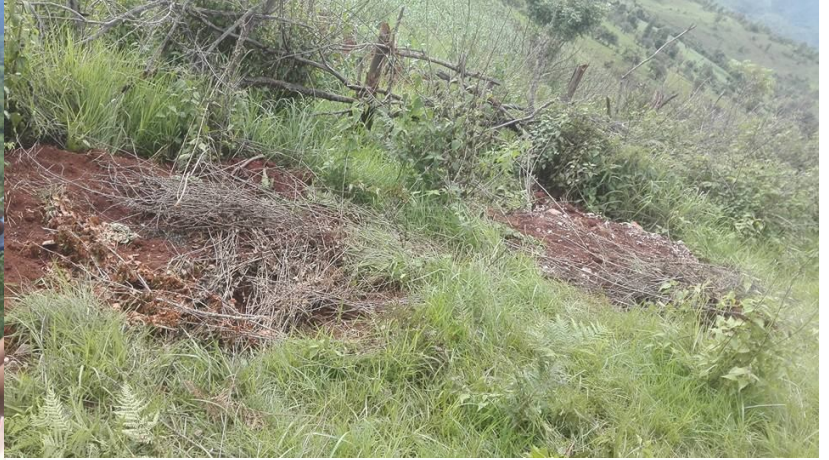
ဂူခင်းဝါခင်းလှိုင်းဂျုမ်းဂခင်ဂျကွင်းတီးဖှင်တူဝ်တံဂူခင်းဝါခင်း 5 ဂေး-မိုဝ်းဝခင်းထိ 29/06/2016