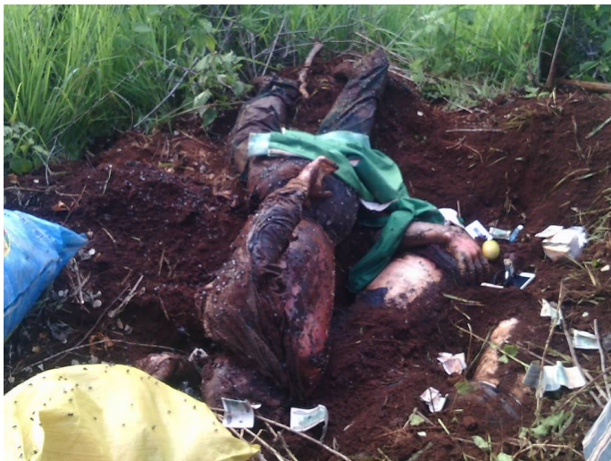
တူဝ်တံဂူခင်းဝါခင်းဂိုတ်း 3 ဂေး.ကခင်ထူပးဂူခင်မိုဝ်းဝခင်းထိ 29/06/2016

ပးလါးကံးသူလှ်,လူ, လာတ်းခဝေး “ ဖှင်းခါးယါမ်း 11:00 ဂါင်ခင်ခခင်. ဂုမ်းခးထူပးဂခင်ခမ်လုဂ်းမ့်,မ့်, သေမီခင်တူ, ကခင်မီးယူ,လွမ်းဂိုမ်းဂိုမ်းသူခင်းခပ်ဂပ်,တီးကခင်ဂုမ်းခးဂိုတ်းဂါခင်။ ဂွမ်းခခင်ဂူခင်းဝါခင်းဂူခင်းသူခင် ဂုမ်းခးဂမ်းဖှင်ခိုခင်း ခုတ်းတူလှ်းခမ်ခခင်. သေလံးဂူခင်တူဝ်တံဂူခင်းယူ,ခင်းခခင်။ လါခင်လါးခးကံးမ့င်, ငတ.မီးခင်းခမ်ခိုင်းသေ ထိုင်ခမ်ခိုင်း ငတ.မီးဂူခင်းသါမ်ဂေး. ကခင်ပီခင်ဂူခင်းဝါခင်းဂိုတ်းခခင်.ယပ်.။ ဖှင်းဂုမ်း ခးဂူခင် တူဝ်တံကံးသူလှ်,လူ,ငလး ကံးမ့င်, ခခင်. ငတ.လံးဂူခင်ခပ်သ့,ဂူခင်းလါးသိုဂ်းဝံ. ဂူလှ်းဂးကမ်,မီး သါဂုတ်. (သါဂုင်.။) တီးသူပးခပ်ခခင်.လံးဂူခင်ကပ်ဖခင်, ဖေးလိတ်. မတ်. ဂုမ်းဝံ.။ တီးကူဂ်းလါးသး,လူ,ခခင်. လံးဂူခင်မာဂ်,ဂွင်းသွင်လုဂ်းငလးတီးတွင်.မခင်းထိုင်သွင်လုဂ်း။ တီးဂျုဝ် ကံးမ့င်, သမ်. လံးဂူခင်ဂွံးပေး.ထုပ်. ခံယပ်.။