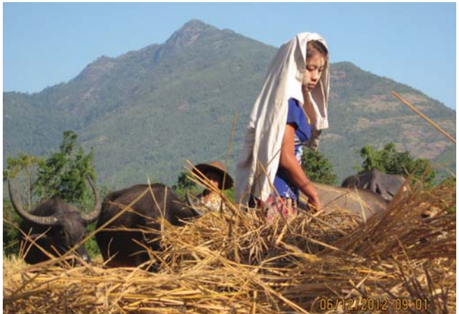
ဤပုံသည် ၂၀၁၂ ခုနှစ် ဒီဇင်ဘာလ ၆ ရက်နေ့တွင်ရိုက်ယူခဲ့သည်။ အမျိုးသမီးဝယ်တစ်ယောက်သည် က...ရွာ၊ ကျေးအကျေးရွာအုပ်စု၊ ဘူးသိုမြို့နယ်၊ ဖာပွန်ခရိုင် နားတွင်စပါးမြေလှေ့နေသောပုံဖြစ်သည်။