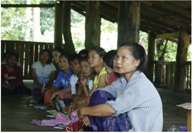
အထက်ပါဖော်ပြပါပုံတွင်ရှိသော အမျိုးသမီးများသည် ၂၀၁၅ ခုနှစ် ဩဂုတ်လ၊ လ...ရွာ၊ ဝါးမီးခလတ်ကျေးရွာအုပ်စု၊ ပိုင်ကျဲမြို့နယ်၊ ဖာပွန်ခရိုင် တွင် ပြုလုပ်သော KHRG တွေ့ဆုံဆွေးနွေးပွဲသို့ တက်ရောက်ခဲ့သော ပုံဖြစ်သည်။