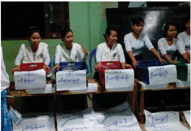
ဤပုံကို KHRGသတင်းစုဆောင်းသူမှ ၂၀၁၅ခုနှစ် နိုဝင်ဘာလ ၈ရက်နေ့ကျွန်းမြို့နယ်၊ ဒူးပလာယာခရိုင် တွင် ရိုက်ကူးထားခြင်းဖြစ်ပါသည်။ ပုံတွင် ကျောင်းဆရာမများမှ တစ်နိုင်ငံလုံးဆိုင်ရာ အထွေထွေရွေးကောက်ပွဲအတွက် မဲရေတွက်ခြင်းကို ကူညီပေးနေသည် ကိုမြင်တွေ့ ရပါမည်။