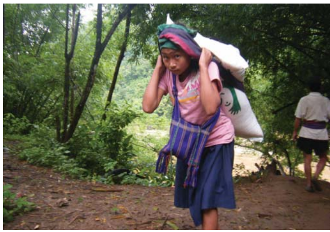
ဤပုံကို ၂၀၁၃ခုနှစ်ဇွန်လ ၂၉ရက်နေ့တွင်ရိုက်ကူးထားပြီး န...ကျေးရွာ၊ဘွားဒဲကျေးရွာအုပ်စု၊ ဘူးသိုမြို့နယ်၊ဖာပွန်ခရိုင်၊ မှ ၁၅နှစ် အရွယ်ရှိ နော် ဖ...၏ ပုံဖြစ်ပါသည်။ သူမကို ပြည်တွင်းနေရပ်စွန့်ခွာထွက်ပြေးနေရသူ ကရင်လူမျိုးများအား အကူအညီပေးရေးကော်မတီမှ ပေးလှူသော ဆန်အိတ် အားသယ်ဆောင်နေပုံကို တွေ့မြင်ရပါမည်။ သူမတို့နေထိုင်ရာ ဒေသတွင် အစာရေစာရှားပါးမှုကြောင့် သူမတို့မိသားစုသည် သူတစ်ပါးလှူဒါန်းသောဆန်ကို ရယူရပါသည်။