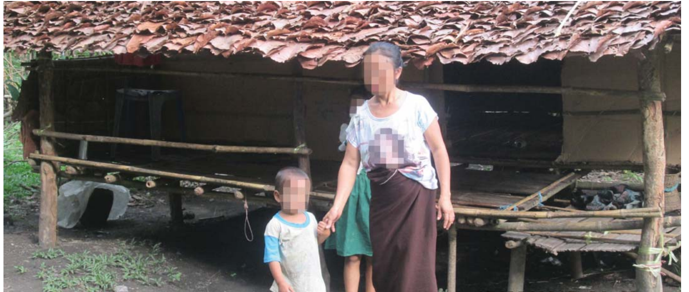
ဤပုံကို ၂၀၁၅ ခုနှစ်၊ ဇွန်လ ၁၅ ရက် နေ့တွင် ဒေသခံ KHRG အဖွဲ့ဝင်မှ ဇ...ကျေးရွာ၊ စခန်းကြီးကျေးရွာအုပ်စု၊ သထုံမြို့နယ်၊ သထုံခရိုင် ၌ ရိုက်ကူးထားခြင်းဖြစ်ပါသည်။ ပုံတွင် မ...နှင့်သူမ၏ ကလေးနှစ်ဦးကို သူတို့၏အိမ်ရှေ့တွင် တွေ့မြင်ရပေမည်။ သူမ၏ခင်ပွန်းစောဘ...သည်စားပြုဖြင့် စွပ်စွဲခံရပြီး ရဲများက သူ့ကိုရှာဖွေရန် သူမတို့၏အိမ်သို့ ညသန်းခေါင်အချိန်မတော် ဝင် ရောက်လာခဲ့ကြပါသည်။ ရဲများသည် မ...ကို သေနတ်ဖြင့်ချိန်ရှယ် ခြိမ်းခြောက်ပြီး သူမယောက်ျား မည်သည့်နေရာတွင်ရှိသည်ကို ပြောဆိုစေခဲ့ပါသည်။