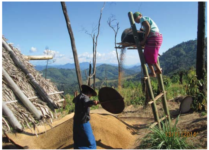
ဤ ပုံကို ဖာပွန်ခရိုင် ဒေါဖူးကျေးရွာအုပ်စု ဘ...ကျေးရွာရှိတောင်ယာတွင် ၂၀၁၄ ခုနှစ် နိုဝင်ဘာလ ၁၃ ရက်နေ့က ရိုက်ကူးထားခြင်းဖြစ်ပါသည်။ ပုံတွင်အမျိုးသမီးများ ရှေးရိုးစဉ်လာ အတိုင်း စပါးလှေနေပုံကို တွေ့မြင်ရပါမည်။ (ဇာတိပုံ KHRG)

KHRG အနေဖြင့် ဤအစီရင်ခံစာသည် မြန်မာနိုင်ငံအရှေ့တောင်ပိုင်းတွင် ဖြစ်ပေါ်နေသော အရေးပြဿနာများအား ဖြေရှင်းရန် လုပ်ဆောင်နေကြသော ပညာရှင်များနှင့် အဖွဲ့အစည်းများအတွက် အလွန်အသုံးဝင်နိုင်သော အရင်းအမြစ်ဖြစ်စေမည်ဟု ယုံကြည်ပါသည်။ ထို့အပြင် ဒေသခံ အမျိုးသမီးများ၏ စိုးရိမ်ပူပန်မှုများနှင့် ၎င်းတို့၏ ကြိုးပမ်းအားထုတ်မှုများအကြောင်းကို လူအများသိရှိရန်အတွက် လုပ်ဆောင်ရာတွင်လည်း ဤအစီရင်ခံစာကို မှီငြမ်းအသုံးပြုနိုင်ပါသည်။ မြန်မာပြည်အရှေ့တောင်ပိုင်း ကျေးလက်ဒေသရှိ အမျိုးသမီးများ ရင်ဆိုင်ကြုံတွေ့နေရမှုများနှင့် ပတ်သက်၍ ၎င်းတို့၏ အမြင်သဘောထား များကို ပိုမိုသိရှိလိုသော သာမန်ပြည်သူများအနေနှင့်လည်း အစိုးရအဖွဲ့များ၊ လူမှုအဖွဲ့အစည်းများနည်းတူ ဤအစီရင်ခံစာအပေါ် စိတ်ပါဝင်စားမှု ရှိလိမ့်မည်ဟု KHRG မှယုံကြည်ထားပါသည်။