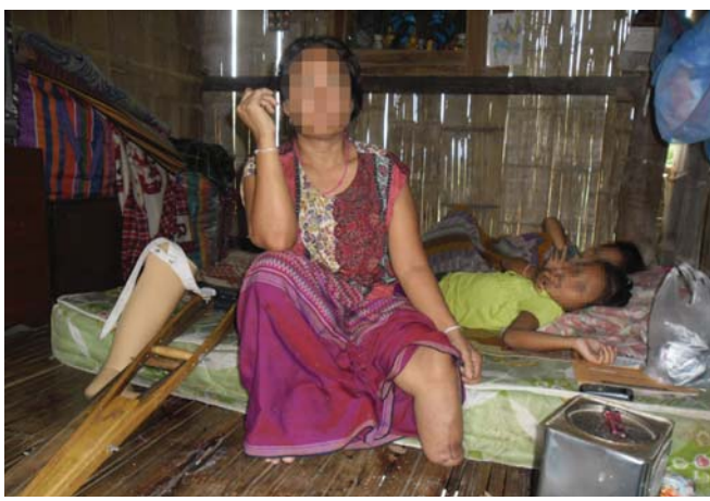
ဤပုံကို KHRG၏ ဒေသခံအဖွဲ့ဝင်မှ ၂၀၁၂ ခုနှစ် ဖေဖော်ဝါရီလ ငွေပလာယာခရိုင်၊ ကော့ကရိတ်မြို့နယ်တွင် ရိုက်ကူးထားပြီး မြေမြှုပ်မိုင်းကြောင့် ဒဏ်ရာရရှိသူ အသက် ၄၇ နှစ်အရွယ် နော်ဂ...၏ပုံ ဖြစ်ပါသည်။ သူမကို ဆေးကုသမှုခံယူရန် ထိုင်းနိုင်ငံမိဆောက်ဆေးရုံသို့ ပို့ဆောင်ပေးခဲ့ပါသည်။ သူမမိုင်းနင်းမိသည့်နေရာတွင်မည်သည့်အမှတ်အသားသတ်ပေး ချက်တစ်ခုမှ မရှိပါ။ သူမမိုင်းနင်းမိသည့်နေရာမှသာ ထိုနေရာတွင်သတ်ပေးသည့်အမှတ်အသားကို လာရောက်စိုက်ထူထားပါသည်။

• အစိုးရနှင့် ကရင်အမျိုးသားအစည်းအရုံးတို့ ၂၀၁၂ ခုနှစ်တွင် အပစ်အခတ်ရပ်စဲရေး ပဏာမ သဘောတူညီမှု ရယူခဲ့ ကြသော်လည်း မြန်မာပြည်အရှေ့တောင်ပိုင်းရှိ အမျိုးသမီးများက ၎င်းတို့သည် မြေမြှုပ်မိုင်းအန္တရာယ်များကို ဆက်လက်ရင်ဆိုင်နေရကြောင်း တင်ပြကြပါသည်။ မြေမြှုပ်မိုင်း အန္တရာယ်ဟုဆိုရာတွင် မြေမြှုပ်မိုင်းများကြောင့် လူသေဆုံးရခြင်း၊ ထိခိုက်ဒဏ်ရာရရှိခြင်း၊ ကျွဲ၊ နွားနှင့် အိမ်မွေးတိရစ္ဆာန်များ ဆုံးရှုံးခြင်းကြောင့် အသက်မွေးဝမ်းကျောင်း လုပ်ငန်းများ ခက်ခဲလာခြင်းနှင့် မြေမြှုပ်မိုင်းများကြောင့် လယ်ယာစိုက်ခင်းများနှင့် တောထဲသို့ သွားရောက်အလုပ်လုပ်ရန် အကန့်အသတ် ဖြစ်ခြင်း စသည်တို့ပါဝင်သည်။