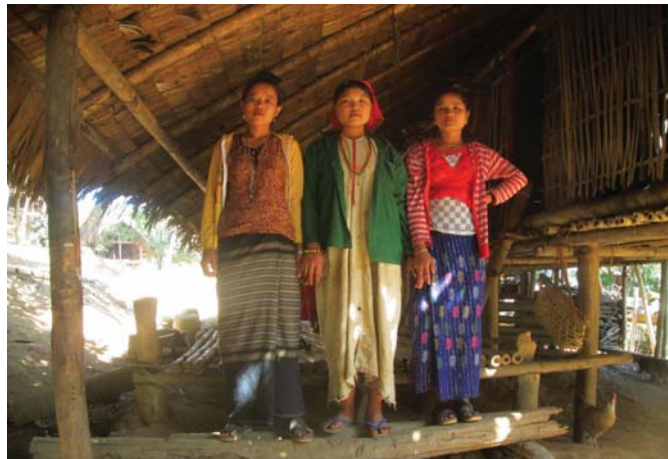
အထက်ပါဖော်ပြပါပုံကို ၂၀၁၅ခုနှစ် ဇန်နဝါရီလ ၂၃ရက်၊ မယ်က လောကျေးနယ်၊ဘူးသိုမြို့နယ်၊ ဖာပွန်ခရိုင်၊ တွင် ရိုက်ယူခဲ့သည်။ အလယ်ကအမျိုးသမီးတစ်ယောက်သည်မင်္ဂလာဆောင်ပြီးသူမ၏သူငယ်ချင်းနှစ် ယောက်နှင့်အတူ အိမ်ကိုပြန်လာသည့်ပုံဖြစ်သည်။