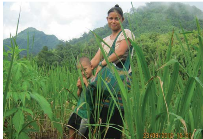
အထက်ပါဖော်ပြပါပုံသည် ၂၀၁၂ ခုနှစ် စက်တင်ဘာလ ၂၃ ရက်၊ မုန်မြို့နယ်၊ ညောင်လေးပင်ခရိုင်တွင် KHRG အဖွဲ့ဝင် ကွင်းဆင်းလုပ်သားတစ်ဦးမှရိုက်ယူခဲ့ပါသည်။ တောင်ယာဒေသတွင် အမျိုးသမီးတစ်ယောက်နှင့် သူမရဲ့ ကလေးတစ်ဦး၏ပုံ ဖြစ်သည်။