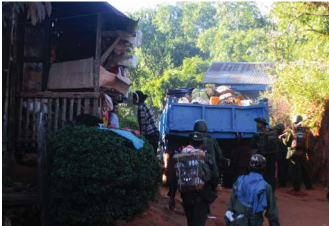
ဤပုံကို ၂၀၁၄ခုနှစ် ဒီဇင်ဘာလ ၁ရက်၊ ၈---ကျေးရွာ၊ ထန်းတပင်မြို့နယ်၊ တောင်ငူခရိုင်တွင် KHRGဒေသခံအဖွဲ့ဝင်တစ်ဦးမှ ရိုက်ကူးထားပြီး တပ်မတော်စစ်သားနှင့် စစ်ကားများက---ရွာသို့ရွှေ့ပြောင်းသွားသည့်ပုံဖြစ်ပါသည်။ ဓါတ်ပုံထဲတွင်ပါရှိသည့်တပ်မတော်စစ်သားများပုံသည် (စကခ)အမှတ်၅ အဖွဲ့မှ တပ်မတော် စစ်သားများဖြစ်ပါသည်။ အဆိုပါစစ်သားများသည်ဘူးဆရွာရှိ အရှေ့တန်းတပ်စခန်းသို့၎င်းတို့စစ်ကြောင်းမှပြောင်းရွှေ့ရိက္ခာသယ်ယူနေခြင်းဖြစ်ပါသည်။တချိန်တည်းမှာပင် ၎င်းတို့သည် လမ်းများကိုလည်း ပြုပြင်ခဲ့ကြပါသည်။