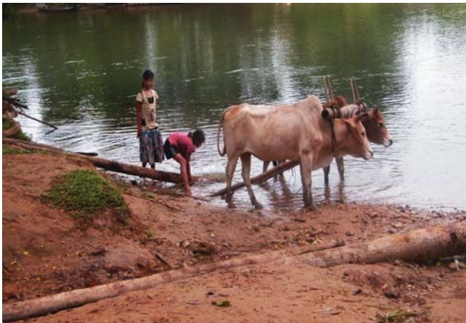
ဤပုံကို...ကျေးရွာဒေသကျေးရွာအုပ်စုဖွဲ့စည်းရာတွင် ၂၀၁၂ ခုနှစ် အောက်တိုဘာလ ၁၀ ရက်နေ့က KHRG ၏ ဒေသခံအဖွဲ့ဝင်တစ်ဦးမှ ရိုက်ကူးထားပါသည်။ ပုံတွင်အမျိုးသမီးငယ်နှစ်ဦး ကျေးရွာများတွင် လုပ်လေ့ရှိသော အသက်မွေးဝမ်းကျောင်းလုပ်ငန်းတွင်ပါဝင်လုပ်ကိုင်နေခြင်း ဖြစ်ပါသည်။