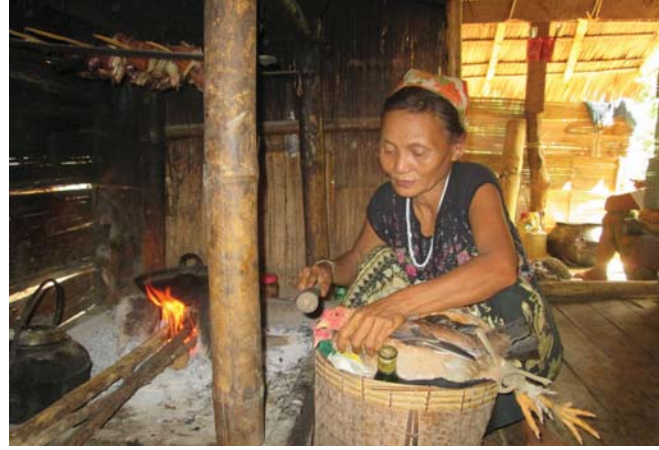
အထက်ပါဖော်ပြပါပုံသည် ၂၀၁၅ ခုနှစ် ဧပြီလ ၂၈ ရက်၊ တီ...ရွာ၊ မယ်ကလေးကျေးရွာအုပ်စု၊ ဘူးသိုမြို့နယ်၊ ဖာပွန်ခရိုင်တွင်ရိုက်ယူခဲ့သည်။ အမျိုးသမီးတစ်ယောက်သည် ၎င်း၏ ရိုးရာလေ့အစဉ်အလာပွဲကို ကျင်းပရန် တစ်ဖက်တစ်လမ်းမှ ပါဝင်ဆင်နွှဲနေသောပုံဖြစ်သည်။