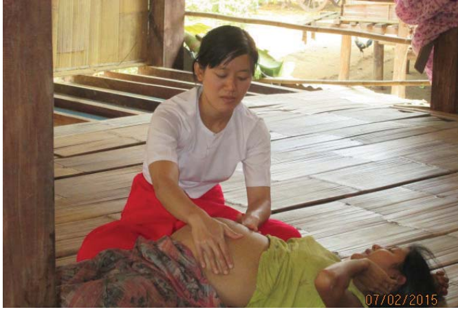
ဤဓာတ်ပုံကို ၂၀၁၅ ခုနှစ် ဖေဖော်ဝါရီလတွင်ရိုက်ကူးခဲ့ပြီး မ... ကျေးရွာ၊ ကြာအင်းဆိပ်ကြီး မြို့နယ်၊ ဒူးပလာယာခရိုင်မှ အစိုးရသူနာပြုတစ်ဦး၏ပုံဖြစ်ပါသည်။ ၎င်းသူနာပြုမှ ၂ နှစ်အောက် ကလေးငယ်များ ကာကွယ်ဆေးထိုးရန်တိုက်တွန်းခဲ့ပြီး ကိုယ်ဝန်ဆောင်မိခင်တစ်ဦးအားကျန်းမာရေးစစ်ဆေးပေးနေသောပုံဖြစ်ပါသည်။