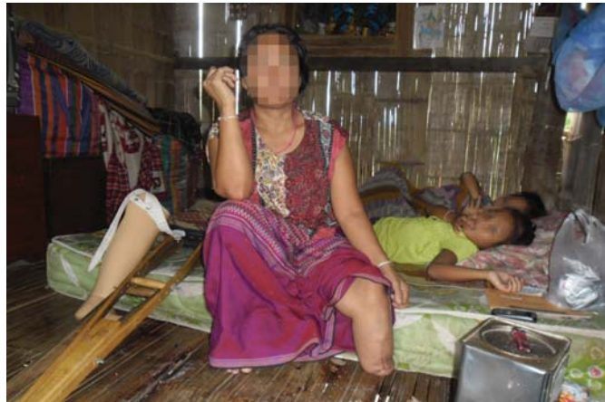
တၢ်ဂီၤတဘျီအံၤဘၣ်တၢ်ဒိအိၣ်လၢလီၤကဝီၤ KHRG ပုၤမၤတၢ်ဖိဖဲလၢမ့ၢ်တြိအါရံၤ ၂၀၁၂ န့ၣ်. ဖဲန့ၣ်---သဝီ, ကိးတရံးကီၢ်ဆၢၣ်, န့ၣ်ပုၤယာ်ကီၢ်ရၢၣ်အပူၤန့ၣ်လီၤ. တၢ်ဂီၤအံၤဟ်ဖျါဝဲနီၢ်ဖဲ---လၢအသးန့ၣ်အိၣ်ဝဲဂ့ၣ်န့ၣ်တဂၤ, ဘၣ်ဒိဝဲဒၣ်ဒီးဟီုလၢ်မ့ၢ်ပိတ်တၢ်လီၤလၢအဘူးဒီးန့ၣ်---သဝီ, တရၤဒီးလၢတၢ်ဟ်လီၤတၢ်ဟ့ၣ်ပလီၢ်တၢ်ပနီၣ်ဖဲတၢ်လီၤန့ၣ်ဒီးဘၣ်အခါန့ၣ်လီၤ. အခိၣ်စ့ၣ်တကပၤဘၣ်ဒိဒီးလၢခံဘၣ်ဒိၣ်တုၣ်ကွံာ်ဝဲဒၣ်န့ၣ်လီၤ. အဝဲလဲၤဒီးကူၤစါသးဖဲမံၤဆိးတၢ်ဆါဟံၣ်လၢယိၤကီၢ်ပူၤန့ၣ်လီၤ. နီၢ်ဖဲ---အိၣ်ဒီးအဖိဖဲဂၤန့ၣ်လီၤ. [တၢ်ဂီၤ-KHRG]