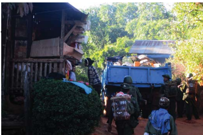
တၢ်ဂီၤတဘျီအံၤ ဘၣ်တၢ်ဒီးအိၤလၢ လီၢ်ကဝီၤ KHRG ပုၤမၤတၢ်ဖိ ဖဲလါဒ်ခဲဘၣ်သီ, ၂၀၁၅န့ၣ်, ဖဲက---သဝီ, ထီတထူၣ်ကိၣ်ဆၣ်, တီဆူကီၢ်ရၣ်အပူၤန့ၣ်လီၤ. တၢ်ဂီၤအံၤဟံၣ်ဖျါဝဲ ကီၢ်ပယီၤသးဖိတဖၣ် လၢ သးပၤဆူၤဝဲကျါ (စကခ)နီၣ်ဂံၢ်(၅)ဒီးလဲၤခိဘၣ်ဝဲက---သဝီပူၤ ဖဲအဆိတလဲလီၢ်အခါန့ၣ်လီၤ.သးဖိတဖၣ်အံၤလၢဆူၤဝဲသးတၢ်အိၣ်တၢ်အိၣ်တဖၣ်ဒီး သးစုကဝဲၤတဖၣ်အသးကလၢလၢအဆိၣ်လၢ တၢ်မံၤညါဖဲ ဘုဆၣ်ခံသဝီပူၤန့ၣ်လီၤ.