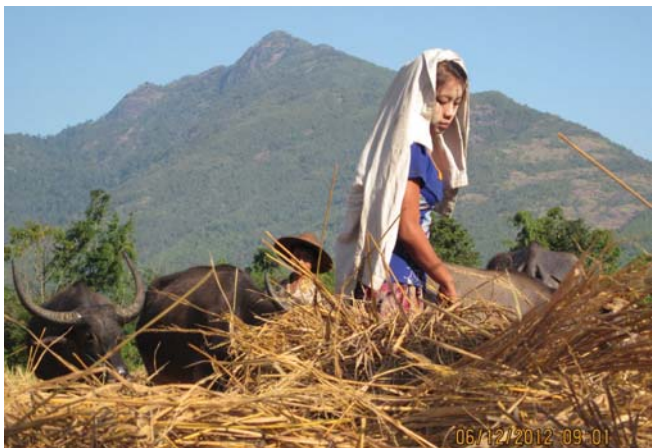
တၢ်ဂီၤတဘျီအံၤဘၣ်တၢ်ဒီးအိၤ ဖဲလါဒ်ခဲဘၣ်ဖဲသီ, ၂၀၁၂န့ၣ်အန့ၢ်န့ၣ်လီၤ. တၢ်ဂီၤအံၤဟံၣ်ဖျါဝဲ ဟံၣ်မုၢ်ဖိ တဂၤ ယူၤဘုဝဲ ခ--- သဝီ, ကိၤပယီၤကရူၢ်, ဘုသိၣ်ကီၢ်ဆၣ်, မုၢ်တြီၤ (ဖၣ်ပုၣ်) ကီၢ်ရၣ်အပူၤန့ၣ်လီၤ.