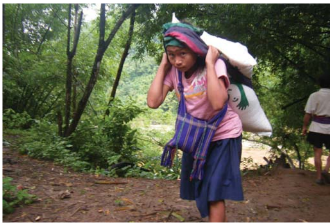
တၢ်ဂီၤတဘျီအံၤဘၣ်တၢ်ဒီးအိၤ ဖဲလါယူၤ ၂၉သီ, ၂၀၁၃န့ၣ်အပူၤ ဒီးဟံၣ်ဖျါဝဲနီၢ်ဖ---,သးန့ၣ်အိၣ်ၤၤၤန့ၣ်တဂၤ လၢအဆိၣ်ဝဲဖဲန---သဝီ,ဘျါဒါကရူၢ်,ဘုသိၣ်ကီၢ်ဆၣ်,မုၢ်တြီၤ(ဖၣ်ပုၣ်)ကီၢ်ရၣ်အပူၤန့ၣ်လီၤ.တၢ်ဒီးန့ၣ်အဂီၤဖဲအဝဲဝဲဟ့ၣ်သးထၢၣ်လၢတၢ်ဟ့ၣ်နီၤလီၤဝဲလၢ ကညီဖိပုၤလီၤအိၣ်ကမ့ၢ်ကမံတံၢ် (CIDKP), ဒီးဖျါလၢတၢ်အိၣ်တၢ်အိၣ်တကူတယၢအိၣ်ထီၣ်လၢ အဟံၣ်ကဝီၤပူၤအယိ အဟံၣ်ဖိယိဖိလိာ်ဘၣ်ဝဲဟ့ၣ်သးလၢ တၢ်ဟ့ၣ်မၤစၢၤဝဲတဖၣ်န့ၣ်လီၤ.