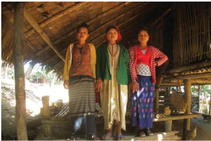
တၢ်ဂီၤအံၤ ဘၣ်တၢ်ဒီးအိၤဖဲ လၢယနူၤအါရံၤ ၂၃သီ, ၂၀၁၅န့ၣ် ဖဲမးကျိကရုၢ်, ဘုသိၣ် ကီၢ်ဆၣ်, ဖၣ်ပုၣ်ကီၢ်ရၣ်န့ၣ်လီၤ. တၢ်ဂီၤအံၤဟ်ဖျါဖဲ ပုၤဒီးသကိးမုၢ် သၢဂၤအံၤ အိၣ် သကိးလိာ်အသး ဖဲအသကိးမုၢ်လၢအခါၣ်သးတဂၤအံၤ ဖျီအသးဝံၤအလီၢ်ခဲန့ၣ် လီၤ.