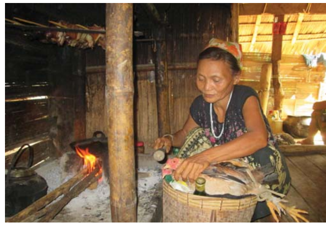
တၢ်ဂီၤတဘျီအံၤဘၣ်တၢ်ဒီးအိၤဖဲလါအုဖြၣ် ၂၈သီ, ၂၀၁၅န့ၣ်အပူၤဖဲ ဘ---သဝီ, မံာ်ကျိကရုၢ်, ဘုသိၣ်ကီၢ်ဆၣ်, မုၢ်တြီၤ (ဖၣ်ပုၣ်) ကီၢ်ရၣ်အပူၤန့ၣ်လီၤ. တၢ်ဂီၤ အံၤဟ်ဖျါထီၣ်ဝဲပိာ်မုၢ်တဂၤကတဲာ်ကတီၤယာ် ဆၣ်ဖိကီၢ်ဖိ လၢတၢ်ကလုာ်ထီၣ် တၢ်အဂီၢ် ဒ်လုာ်လၢအိၣ်ဝဲအသိး န့ၣ်လီၤ.