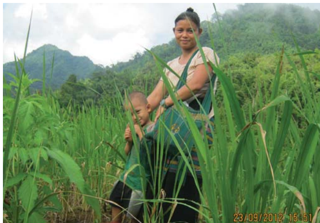
တၢ်ဂီၤတဘျီအံၤဘၣ်တၢ်ဒီးအိၤ လၢလီၢ်ကဝီၤ KHRG ပုၤမၤတဖၣ်ဖဲ ဖဲလါဖဲပထု ဘၣ် ၂၃သီ, ၂၀၁၂န့ၣ်အပူၤဖဲ မုၢ်ကီၢ်ဆၣ်, ချၢၣ်လွံၢ်ထူၣ်ကီၢ်ရၣ်အပူၤန့ၣ်လီၤ. တၢ် ဂီၤအံၤဟ်ဖျါထီၣ်ဝဲ ပိာ်မုၢ်တဂၤဒီး အဖိခွါတဂၤဖဲအလုးပူၤန့ၣ်လီၤ.