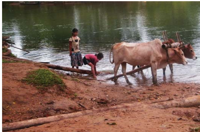
တၢ်ဂီၤတဘျီအံၤ ဘၣ်တၢ်အိၣ်ဆူၣ်အိၣ်ချ့လၢ လီၢ်ကဝီၤ KHRG ပုၤမၤတၢ်ဖိ ဖဲလၢအိးကထိဘၣ်၁၀၀သိ, ၂၀၁၂ န့ၣ်, ဖဲ၁---သဝီ, ဒုဝါကရၢ်, မုၢ်တြီၤ(ဖၣ်ပုၣ်)ကိၣ်ရၢ်အပူၤန့ၣ်လီၤ. တၢ်ဂီၤအံၤဟ်ဖျါဝဲဖိသ့ၣ်ပိာ်မုၢ်ခံၣ်မၤတၢ်မၤလၢအတၢ်လုၢ်အိၣ်သးသမူအဂီၢ်န့ၣ်လီၤ.