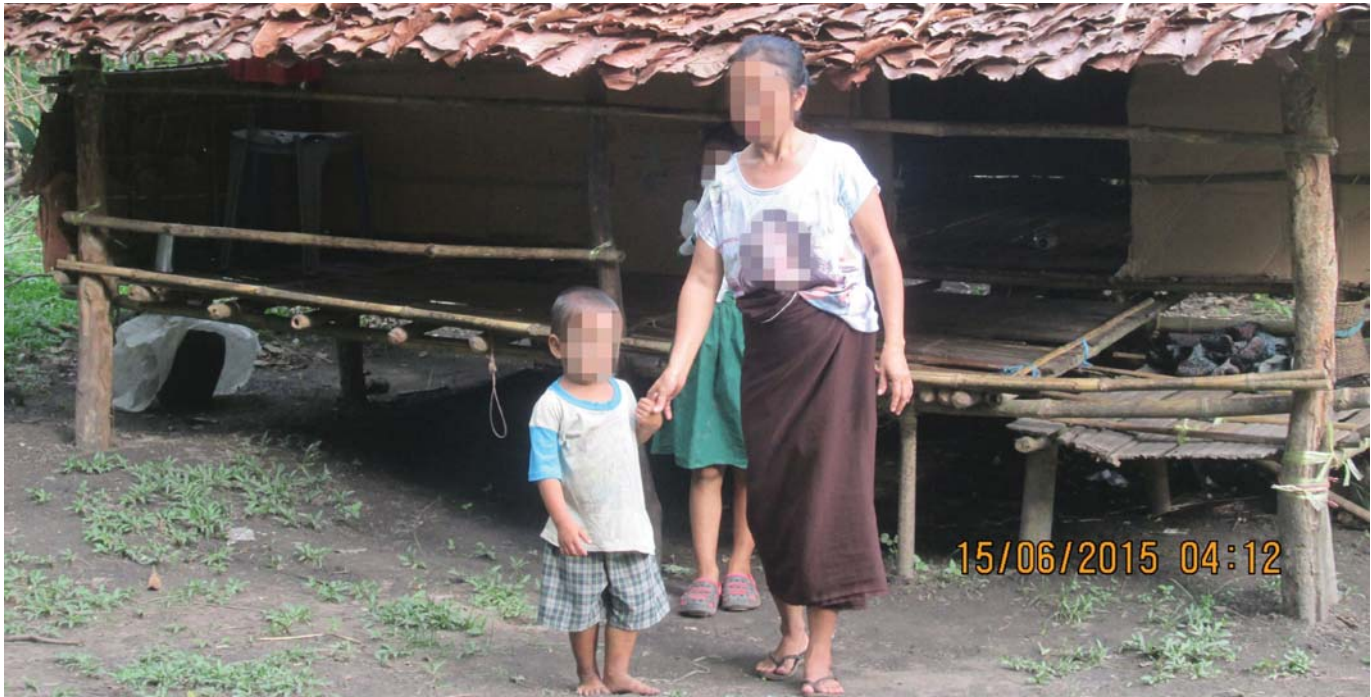
တၢ်ဂီၤတဘျီအံၤဘၣ်တၢ်ဒီအီၤလၢ လီၤကဝီၤ KHRG ပှၤမၤတၢ်ဖိ ဖဲလၢယုၤ၁၅သီ,၂၀၁၅ န့ၣ် ဖဲအ---သဝီ, နူသထူၣ်ကီၢ်ရှၢ်အပူၤန့ၣ်လီၤ. တၢ်ဂီၤအံၤမ့ၢ်ဝဲနီၢ်ဖ---ဒီးအဖိခံၤအိၣ်လၢအဟံၣ်မဲာ်ညါန့ၣ်လီၤ.ဖဲနီၢ်ဖ---အဝဲပှၤဆိမိၣ်ကမၣ်အီၤလၢအဟ့ၣ်တၢ်,တမ့ၢ်တၢ်ဝဲအလီၢ်ခံၤပၤကီၢ်သ့ၣ်တဖၣ်ဟဲအူအဟံၣ်လၢမ့ၢ်န့ၢ်ခိဖးမၤပျံၤမၤ ဖုးအီၤ.ပညိၣ်အီၤလၢကျိၣ်ခိၣ်ဒီးသံကွၢ်ဝဲအဝဲအိၣ်ဖဲလဲၣ်န့ၣ်လီၤ.