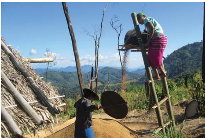
တၢ်ဂီၤတဘျီအံၤဘၣ်တၢ်ဒီးအိၤဖဲ လၢနီၣ်ဝုဘၣ် ၁၃သီ, ၂၀၁၄န့ၣ် ဖဲတၢ်လုာ်ကျါလၢ အဘျးဒီးဟ---သဝီ, ခိပူၤကရုၢ်, မုၢ်တြီၤ (ဖၣ်ပုၣ်) ကီၢ်ရၣ်အပူၤန့ၣ်လီၤ. တၢ်ဂီၤအံၤ ဟ်ဖျါထီၣ်ဝဲ ပိာ်မုၢ် ၂၀၁ ဝံၣ်ဘုဖဲအခြီၤပူၤန့ၣ်လီၤ.