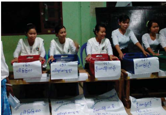
တၢ်ဂီၤတဘျီအံၤဘၣ်တၢ်ဒီးအိၤ လၢလီၢ်ကဝီၤ KHRG ပုၤမၤတၢ်ဖိ ဖဲလါနီၣ်ဝဲဘၣ်သီ, ၂၀၁၅န့ၣ်အပူၤ ဖဲတြီၤတုၤကီၢ်ဆၣ်, နုပျီၤယာ်ကီၢ်ရၣ်အပူၤန့ၣ်လီၤ. တၢ်ဂီၤအံၤဟံၣ်ဖျါထီၣ်ဝဲ ကိၤသရၣ်မုၢ်တဖၣ်မၤစၢၤ ဒီးဂံၢ်ဝဲ တၢ်ဟ့ၣ်တၢ်ဖးအဆၢလၢထံကီၢ်ဒီးဘၣ်တၢ်ပတုၣ်တၢ်ခးမၤစၢၤအဂီၢ်န့ၣ်လီၤ.