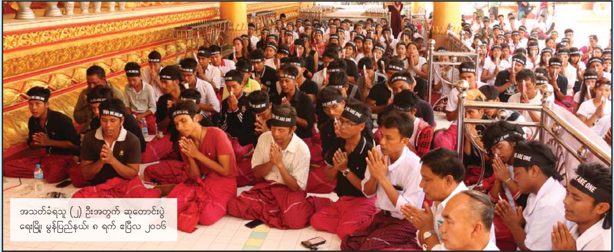
အသတ်ခံရသူ (၂) ဦးအတွက် ဆုတောင်းပွဲ ရေးမြို့၊ မွန်ပြည်နယ်၊ ၈ ရက် ဧပြီလ ၂၀၁၆