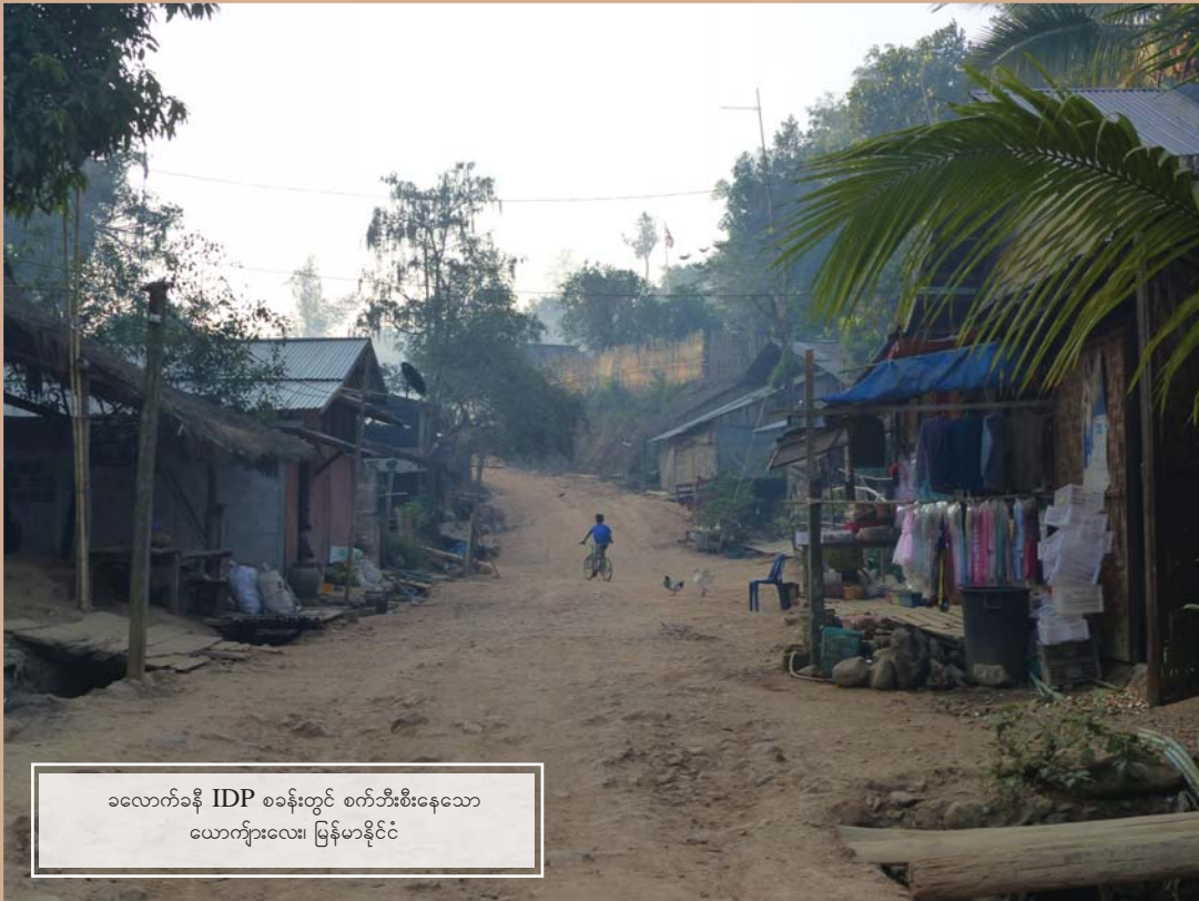
ခလောက်ခနီ IDP စခန်းတွင် စက်ဘီးစီးနေသော ယောက်ျားလေး၊ မြန်မာနိုင်ငံ