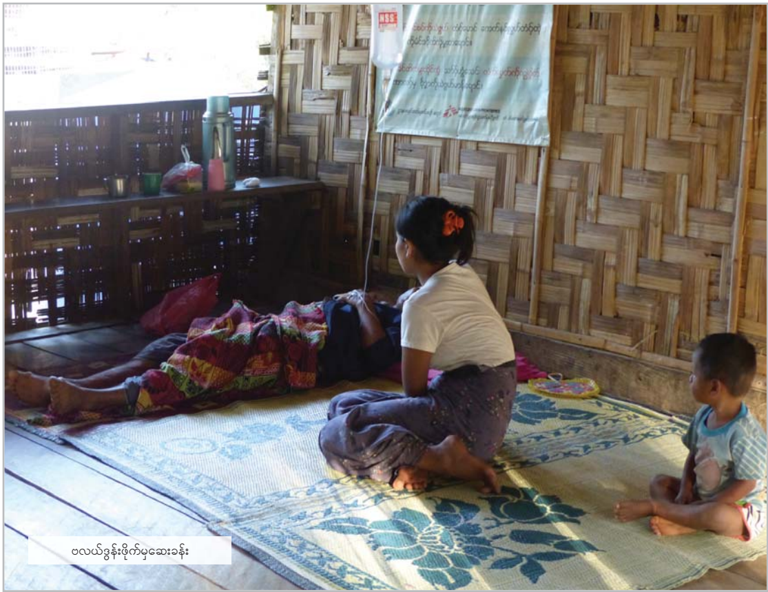
ဗလယ်ခွန်းဖိုက်မှဆေးခန်း