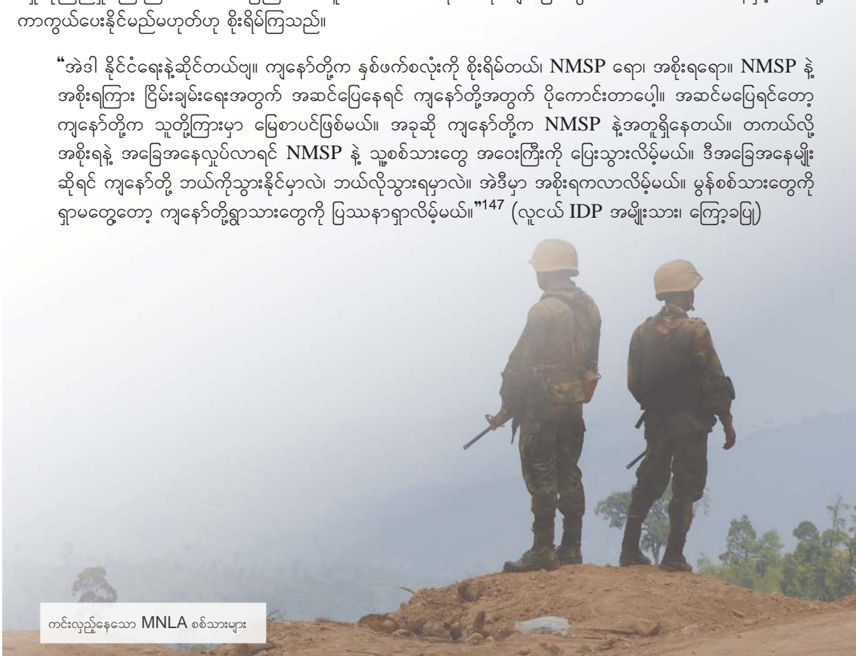
ကင်းလှည့်နေသော MNLA စစ်သားများ

“အဲဒါ နိုင်ငံရေးနဲ့ဆိုင်တယ်ဗျ။ ကျနော်တို့က နှစ်ဖက်စလုံးကို စိုးရိမ်တယ်။ NMSP ရော၊ အစိုးရရော။ NMSP နဲ့ အစိုးရကြား ငြိမ်းချမ်းရေးအတွက် အဆင်ပြေနေရင် ကျနော်တို့အတွက် ပိုကောင်းတာပေါ့။ အဆင်မပြေရင်တော့ ကျနော်တို့က သူတို့ကြားမှာ မြေစာပင်ဖြစ်မယ်။ အခုဆို ကျနော်တို့က NMSP နဲ့အတူရှိနေတယ်။ တကယ်လို့ အစိုးရနဲ့ အခြေအနေလှုပ်လာရင် NMSP နဲ့ သူ့စစ်သားတွေ အဝေးကြီးကို ပြေးသွားလိမ့်မယ်။ ဒီအခြေအနေမျိုးဆိုရင် ကျနော်တို့ ဘယ်ကိုသွားနိုင်မှာလဲ၊ ဘယ်လိုသွားရမှာလဲ။ အဲဒီမှာ အစိုးရကလာလိမ့်မယ်။ မွန်စစ်သားတွေကို ရှာမတွေ့တော့ ကျနော်တို့ရွာသားတွေကို ပြဿနာရှာလိမ့်မယ်။” 147 (လူငယ် IDP အမျိုးသား၊ ကြော့ခပြု)