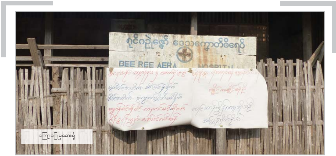
ကြောခပြုမှဆေးရုံ

“MRDC က ငွေရခဲ့တဲ့ နောက်ဆုံးအချိန်က ၂၀၁၅ နိုဝင်ဘာလောက်မှာပေါ့။ အဲ့ဒီငွေက စားစရာနဲ့ ဆေးဝါးအတွက် ကုန်သွားတယ်။ ကျနော် [ကျပ်] ၂၅,၀၀၀ ရတာ နှစ်ပတ်ပဲခံတယ်။ MRDC က ထောက်ပံ့ကြေးက တစ်နှစ်ထက် တစ်နှစ် နည်းလာတယ်။” 120 (ပုံမှန်ဆေးကုဆေးစားနေရသည့် မြေမြှုပ်ခိုင်းဒဏ်ခံ IDP အမျိုးသား၊ ကြောခပြု - ဖြစ်ရပ်လေ့လာမှု ၂ တွင်ကြည့်ပါ။)