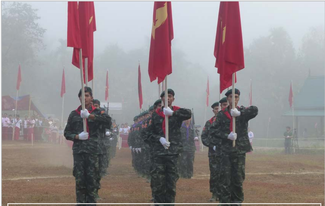
၂၀၁၆ ခုနှစ် ဖေဖော်ဝါရီ ၂၄ ရက်က ပနာမ်ပိန်တွင် မွန်အမျိုးသားနေ့ အခမ်းအနားကျင်းပသော MNLA စစ်သည်များ