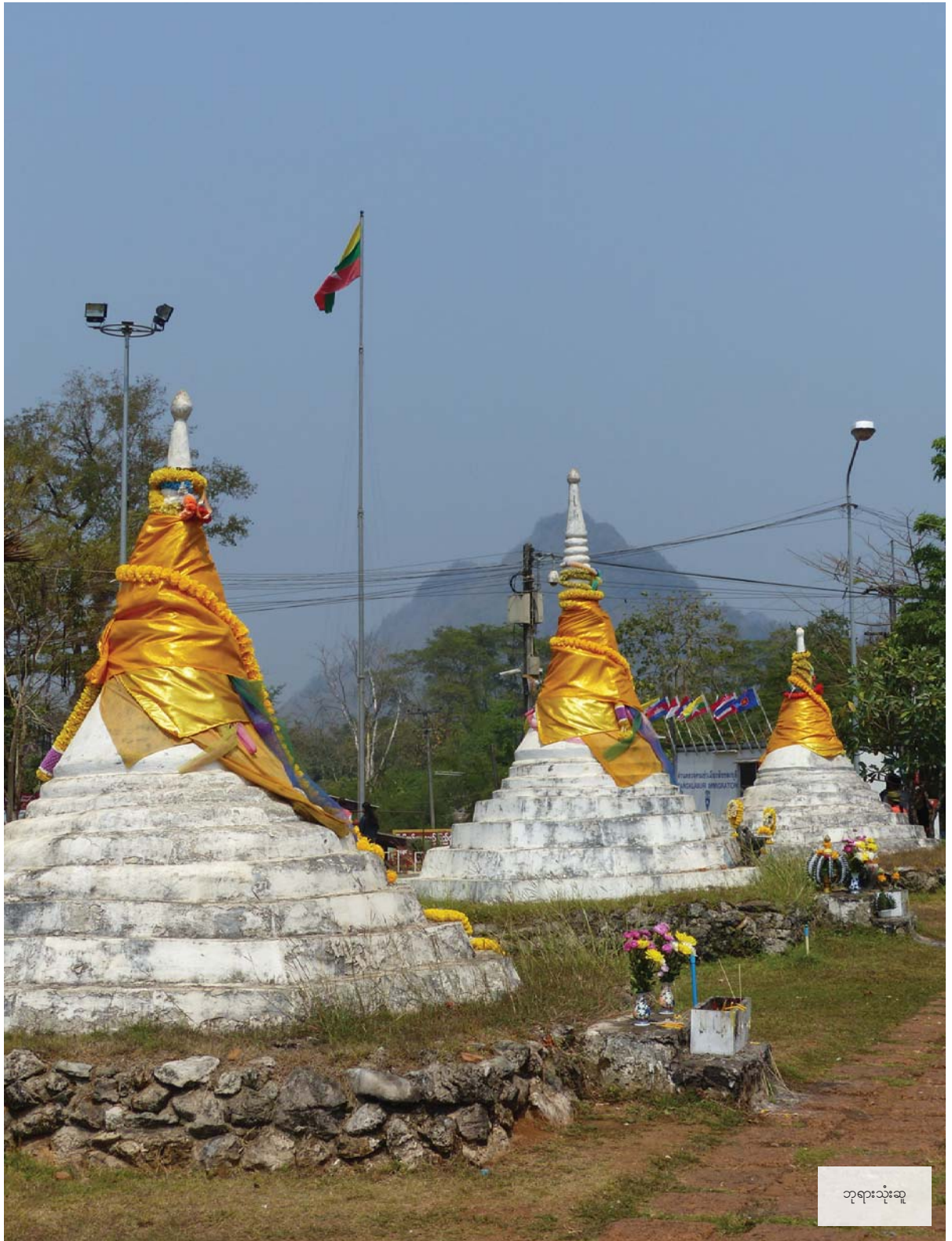
ဘုရားသုံးဆူ