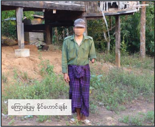
ကြော့ခပြုမှု နိုင်ဟောင်ချန်း

နှစ်ပေါင်းများစွာကြာမြင့်ခဲ့သော လက်နက်ကိုင်ပဋိပက္ခကြောင့် မြန်မာနိုင်ငံအရှေ့တောင်ပိုင်းမှ ဒေသအစိတ်အပိုင်း အတော်များများသည် ယခုအခါ မြေမြှုပ်မိုင်းများဖြင့် ပြည့်နှက်နေသည်။ ၂၀၁၄ ခုနှစ်တွင် TBC မှ ဦးဆောင်သည့် ကျယ်ပြန့်သော သုတေသနပြု လေ့လာချက်အရ မြန်မာနိုင်ငံ အရှေ့တောင်ပိုင်းရှိ ကျေးရွာအုပ်စု ၂၂၂ ခု၏ ကျေးရွာအုပ်စုများ၏ ၅၃ ရာခိုင်နှုန်းတွင် မြေမြှုပ်မိုင်းအန္တရာယ် သင့်နေသည်။ 2 ၂၀၁၆ ခုနှစ်တွင် မြန်မာနိုင်ငံ လူ့အခွင့်အရေးအခြေအနေဆိုင်ရာ ကုလသမဂ္ဂ အထူးကိုယ်စားလှယ်က “မြေမြှုပ်မိုင်းများနှင့် မပေါက်ကွဲသေးသည့် ဝှံ့များသည် IDP များ နေရပ်ပြန်ရေးကို တားဆီးနေသည့် အဓိကအကြောင်းရပ်တစ်ခုဖြစ်၍ လွန်ခဲ့သော ၁၅ နှစ်အတွင်း မြေမြှုပ်မိုင်းများကြောင့် ထိခိုက်မှုများမှာ ခန့်မှန်းခြေ ၃,၇၀၀ ရှိခဲ့သည်။ သို့သော် လက်တွေ့တွင် ၎င်းတိန်းဂဏန်းထက် အများကြီးပိုများနိုင်သည်” ဟု မှတ်ချက်ချခဲ့သည်။ 3 မိုင်းကင်းစင်မြန်မာအဖွဲ့က မြေမြှုပ်မိုင်းဒဏ်မှ အသက်ရှင် ကျန်ရစ်သူ ၄၀,၀၀၀ ကျော်ကို တွေ့ရှိဖော်ထုတ်နိုင်ခဲ့သည်။ 4 အထူးကိုယ်စားလှယ်က လက်နက်ကိုင် ပဋိပက္ခနှင့်သက်ဆိုင်သည့် (လက်နက်ကိုင်) အဖွဲ့အားလုံးကို မြေမြှုပ်မိုင်းအသုံးပြုခြင်း ချက်ချင်းရပ်စဲရန် ဆော်ကြခဲ့သည်။ 5 မြန်မာနိုင်ငံသည် မိုင်းအသုံးပြုမှု ပိတ်ပင်ရေးစာချုပ်ကို လက်မှတ်ထိုးထားခြင်း မရှိသေးပေ။