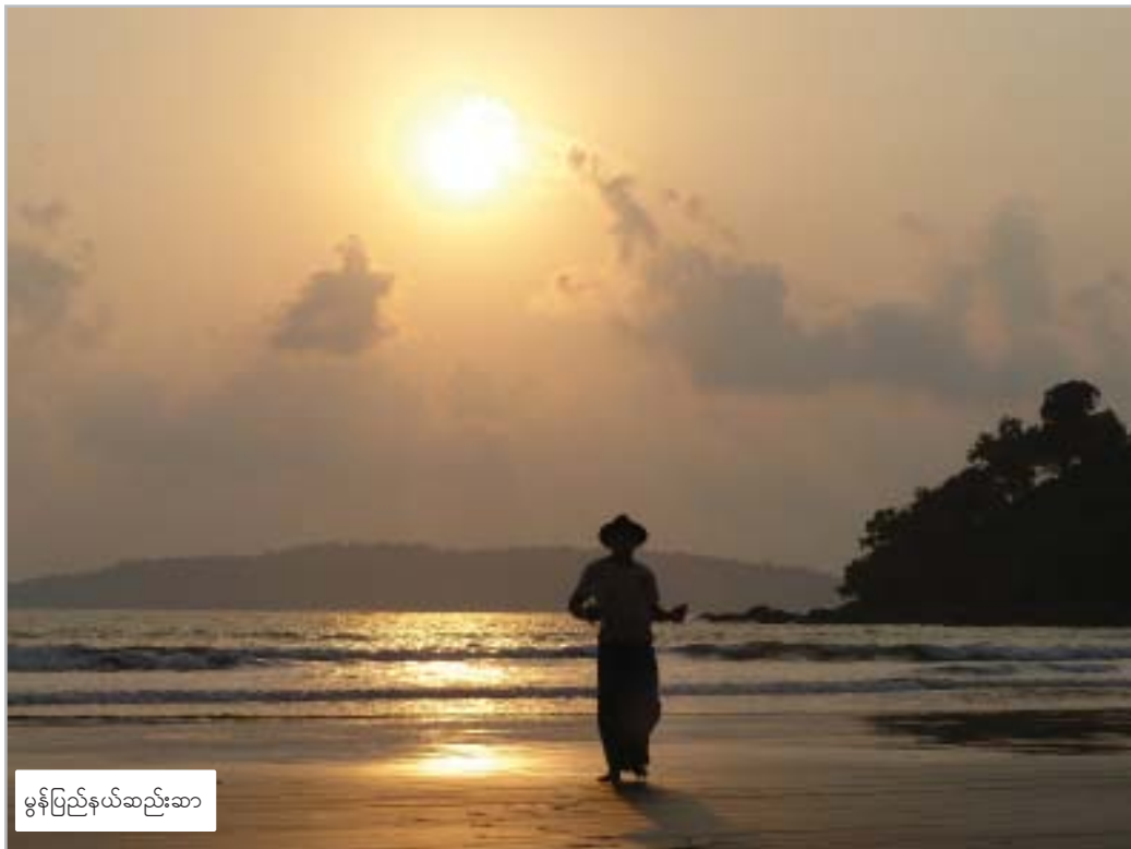
မွန်ပြည်နယ်ဆည်းဆာ

အကယ်၍ ကိုင်တွယ်ဖြေရှင်းမှု မရှိလျှင်သော်လည်းကောင်း၊ နက်နက်နဲနဲ နားလည်စာနာမှုမရှိဘဲ ကိုင်တွယ်ဖြေရှင်းလျှင်သော် လည်းကောင်း မြေယာနှင့်ပတ်သက်သည့် ယင်းအတိတ်နှင့် လက်ရှိမတရားမှုများသည် စစ်မှန်သည့် ငြိမ်းချမ်းရေးကင်းမဲ့ခြင်းနှင့် တွဲဖက်လိုက်သည့်အခါ IDP နှင့် ဒုက္ခသည်များအတွက် ခိုင်မြဲသည့် ဖြေရှင်းချက်များရရန် အဟန့်အတားများဖြစ်နေပြီး ပဋိပက္ခနှင့် လူ့အခွင့်အရေးချိုးဖောက်မှုများ နှစ်ပေါင်းများစွာခံစားခဲ့ရပြီးသော ရပ်ရွာလူထုများမှာ နောက်ထပ် အိုးအိမ်စွန့်ရွှေ့ပြောင်းရမည့် အန္တရာယ် ဆက်လက်ရှိနေဦးမည်ဖြစ်သည်။