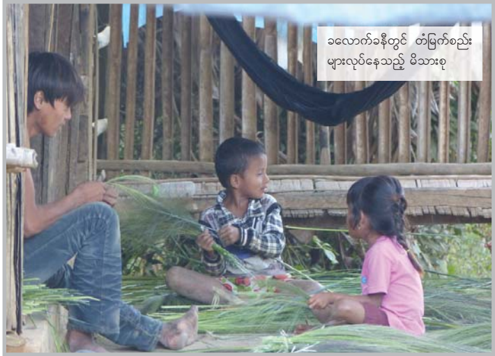
ခလောက်ခနီတွင် တံမြက်စည်း များလုပ်နေသည့် မိသားစု

“အများအားဖြင့် ကျနော်တို့က အစားအစာ အတွက် စိတ်ပူရတယ်။ အစားအစာ မလောက်ဘူး။ ကျနော်တို့က တစ်ရက်လုပ်မှ တစ်ရက်စားရတယ်။ အလုပ်အကိုင် ကောင်း ကောင်းမွန်မွန်မရှိဘူး။” 107 (သက်လတ် IDP အမျိုးသား၊ ချဲဒိုက်)